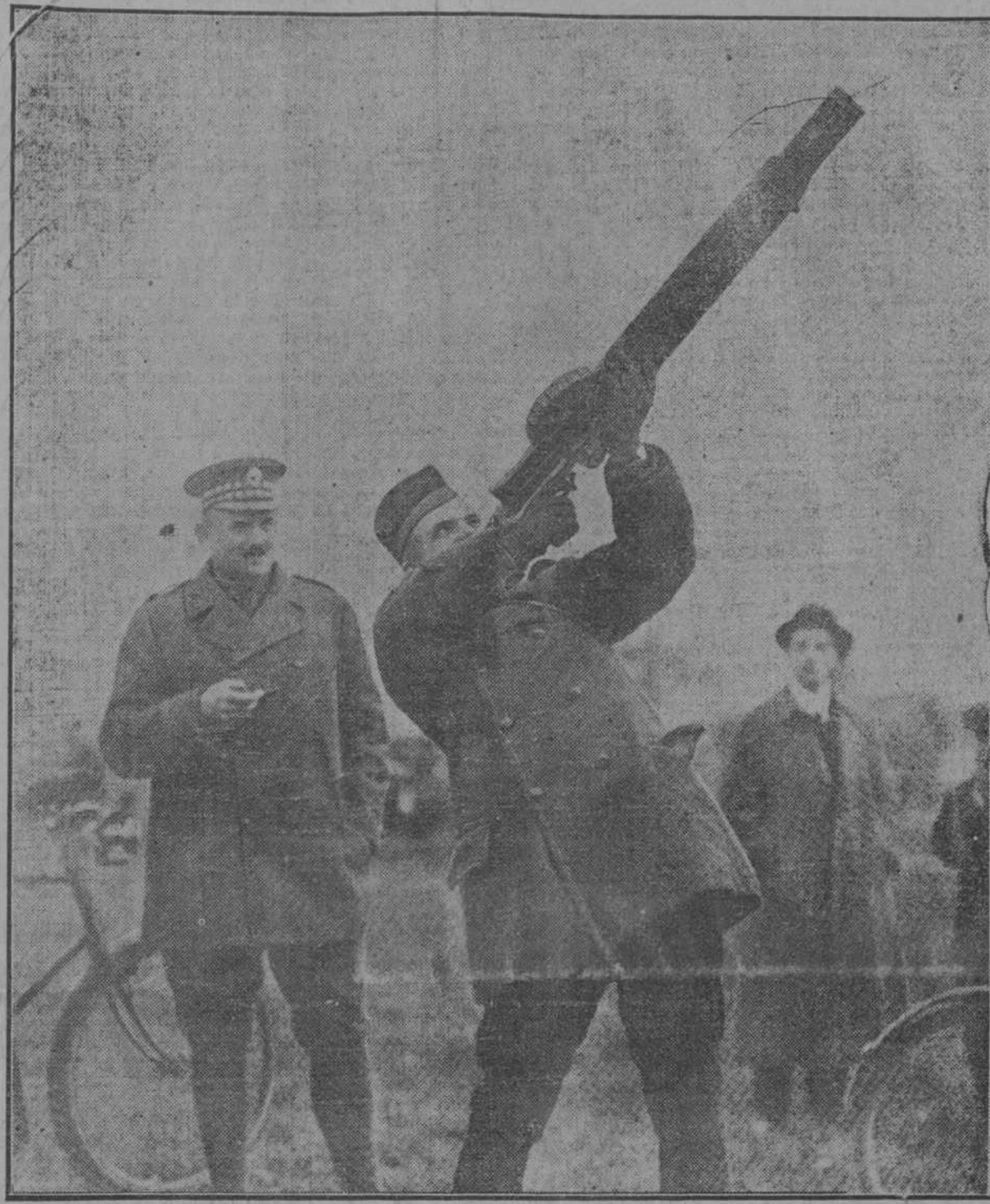
UN OFICIAL DE LA GUARDIA ES COCESA HACIENDO PRACTICAS CON EL FUSIL LEWIS, ADOPTADO YA POR ALGUNOS EJERCITOS, PARA DISPARAR CONTRA LOS AEREOPLANOS.