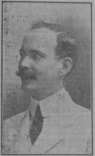
Médico de visita del "Centro Balear"

En la semana pasada ocurrieron lluvias en variada cantidad, en la generalidad de la República, resultando escasas en la mitad occidental de la provincia de Pinar del Río, en el término de Jovellanos, en casi toda la región del N. de las provincias de Santa Clara y de Oriente, no habiendo llovido en el término de San Cristóbal ni en la zona de Holguín; en cuyos lugares, así como por el centro de la provincia de Santa Clara y por la región occidental de la de Camagüey, hacen falta lluvias abundantes para las plantas en cultivo, particularmente en los terrenos altos, colorados. Los vientos fueron variables en dirección y fuerza, predominando los del primero y segunda cuadrantes. Casi diariamente se formaron turbulencias, de las que muchas no desfogaron; algunas produjeron fugadas de viento y descargas eléctricas, causando una de éstas, averías en el techo de una casa en Batabanó, así como daño en varias personas que se hallaban en ella, sin ocasionar la muerte a ninguna. En los lugares en que cayeron lluvias en buena cantidad fueron muy beneficiosas a la agricultura en general y a los potreros.