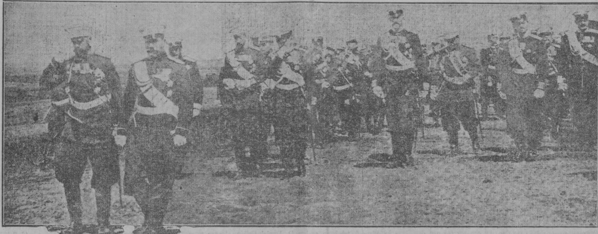
El Zar de Rusia y el Gran Duque Nicolás al frente de un cuerpo de ejército.

Regimientos alemanes segados por la artillería francesa.—Cómo mueren los soldados del Kaiser.—Los aliados han asumido la ofensiva en la gran batalla que se está librando.—Los rusos siguen avanzando.