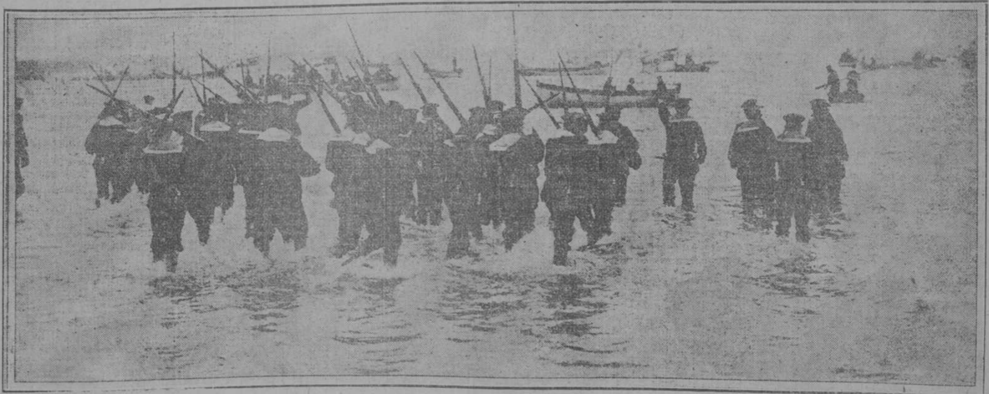
MARINEROS DE GUERRA ALEMANES, EMBARCANDOSE

Al recibir la noticia del fallecimiento de Pío X, se agravó repentinamente.