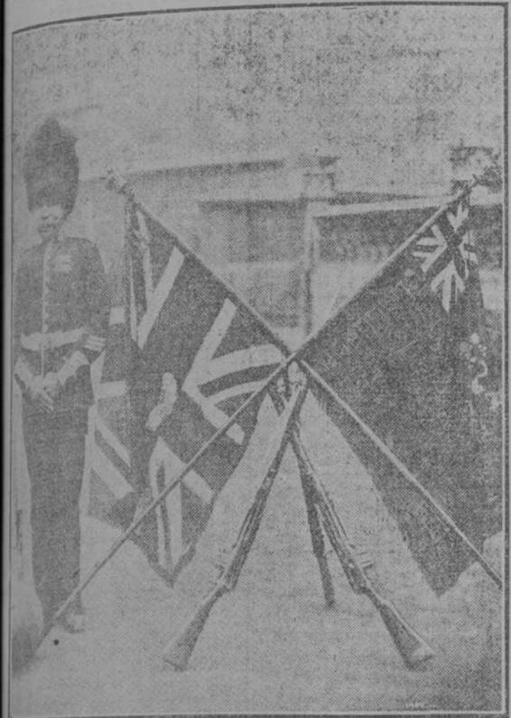
LAS BANDERAS DE LOS GUARDIAS GRANADEROS INGLESES