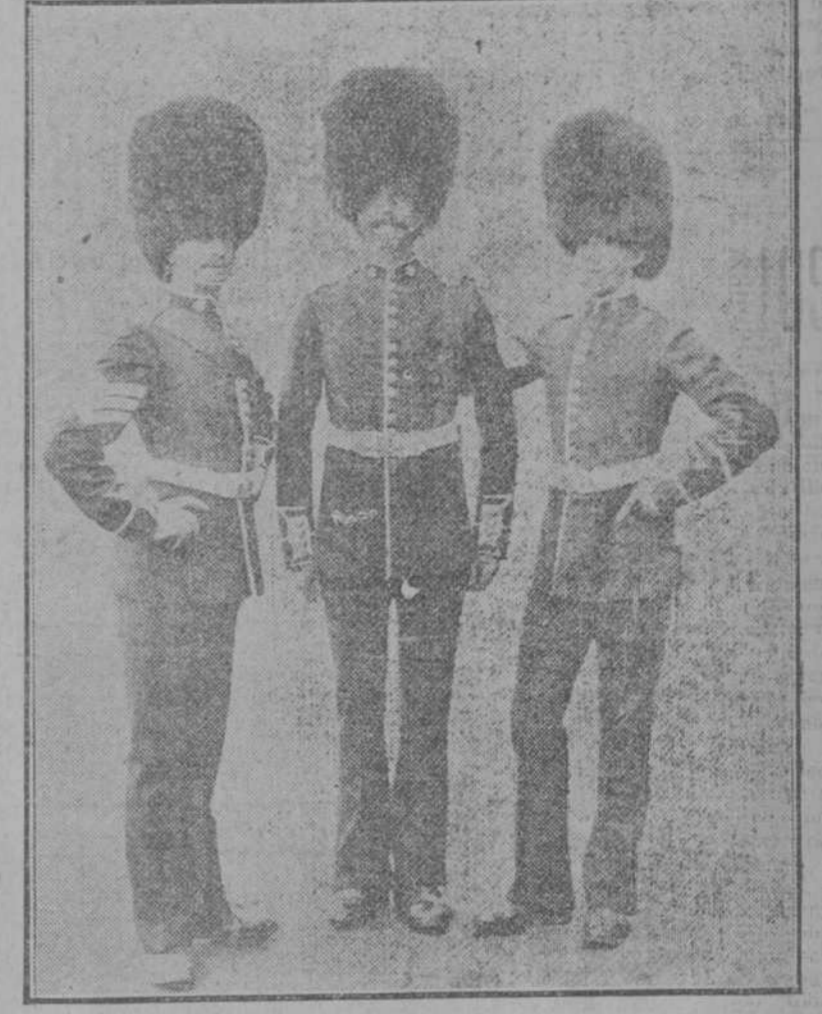
TIPOS DE GUARDIAS IRLANDESES