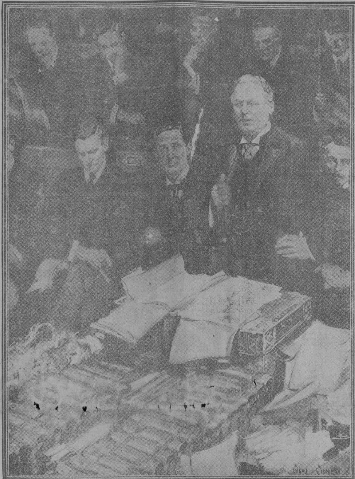
UN MOMENTO SOLEMNE DE LA POLITICA INGLESA.—Mr. Asquith, jefe del Gabinete del Rey Jorge V, anunciándole a la Cámara de los Comunes que la Gran Bretaña le había declarado la guerra al Imperio Alemán.

Si al menos se acabara de una vez y para siempre! Pero es de temer que después de esta horrible carnicería sigan vendidos y vencedores lo mismo que antes: preparándose para la otra. El desarme universal, aunque parece paradoja, es tanto más difícil cuanto más se va adelantando en el camino de la civilización. Aquellos bárbaros que a principios de la Edad Media arrasaron la Europa romana podían, después de su triunfo, haber decretado el desarme, porque los enemigos que no habían perecido en las batallas habían pasado a la misera condición de esclavos. Y sus bienes muebles e inmuebles entraron en el botín y se los repartieron los vencedores. Así las cosas ¿quién había de pensar en la revancha? Pero ahora, merced a las doctrinas del Cristianismo, que, a través de los siglos, han ido modificando las pasiones brutales de los hombres, ya las guerras, por más encarnizadas y crueles que sean, no llevan a la destrucción completa o al aniquilamiento radical y absoluto de los vencidos. Hoy la noticia, verdadera o falsa, de que han sido degollados los habitantes de una aldea, subleva la conciencia pública. Antes de que la civilización cristiana diera sus frutos, la guerra era: muerte o esclavitud de todos los vencidos. No nos hagamos, pues, ilusiones: después de esta lucha espantosa seguirán las cosas, poco más o me-