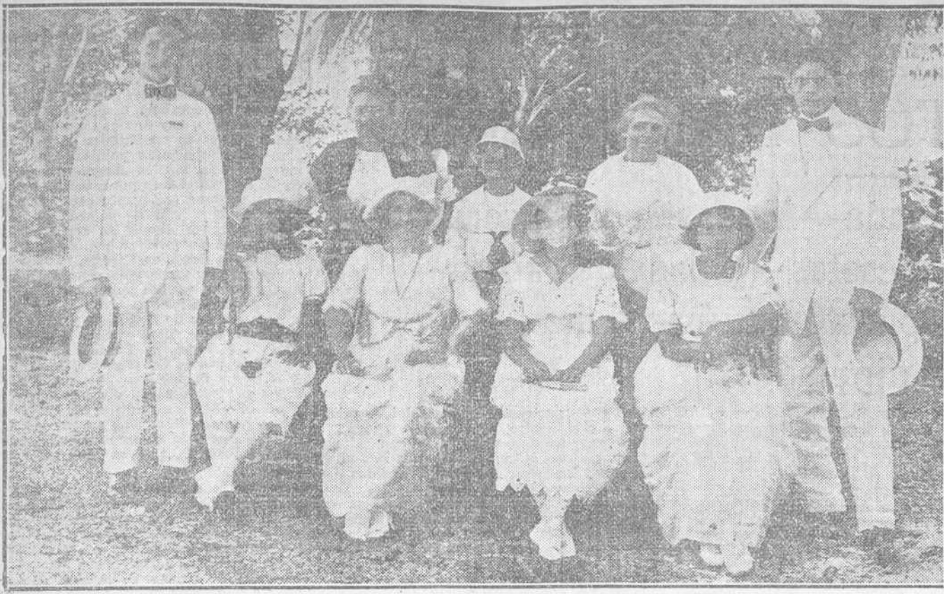
GRUPO DE CONCURRENTES A LA JIRA DE ROSALIA DE CASTRO.