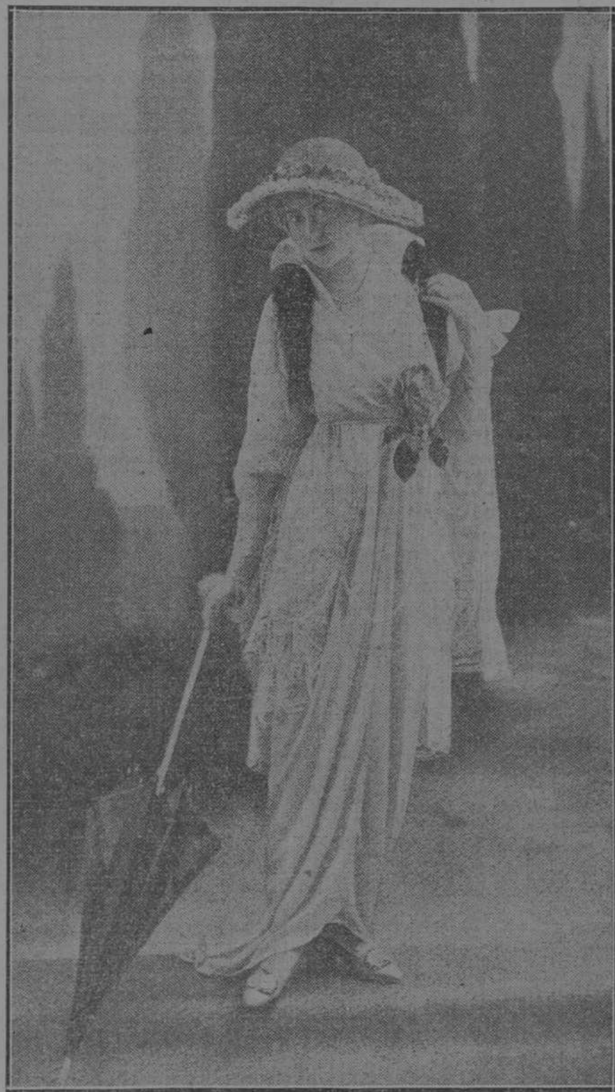
TOILETTE ELEGANTE, MODELO DE LA CASA DOUCET.