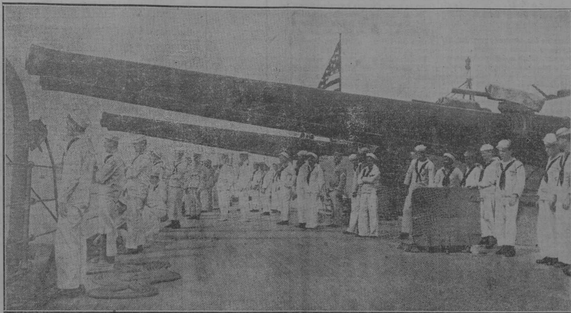
BAJO LOS POTENTES CAÑONES DEL ACORAZADO "FLORIDA", SURTO EN EL PUERTO DE VER ACRUZ.

de la acusación popular iniciaba su informe y le explicaba al Tribunal que esperaba la larga cita que se le había dado para venir a ella, trataba de restarle a la defensa de los procesados cuanto es intangible, cuanto es immanente en el orden del Derecho y de la Justicia. Esa propia acusación popular le decía al Tribunal: