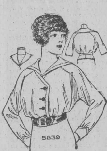
ELEGANTES modelos de trajes y blusas que ofrece a sus favorecedoras la Revista "The Pictorial Review" (Gallano y San Rafael.)