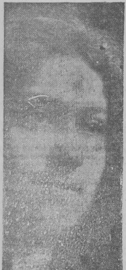
CLEMENTINA GONZALEZ DE LA AMERICA CENTRAL RECUPERÓ LA SALUD. LA PERUNA FUÉ EL REMEDIO.

Droguería SARRA y Farmacias exclusivamente. Botella 15 centavos. Droguería SARRA y Farmacias.