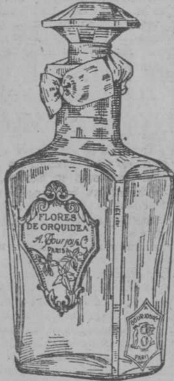
FLORES DE ORQUIDEAS el perfume favorito de la Sociedad Londinense, la flor preferida por Lord Chamberlain, el célebre ministro inglés. ESENCIA, POLVOS Y LOTION NO hay nada igual ni más nuevo. De venta en todas partes. Al por mayor Las Filipinas, San Rafael 9. Tele. A-3784 C 4437 alt. 8-17

Todavía en España pueden decirse muchas cosas, que no es posible repetir en el extranjero. ¡Cuántos asuntos tratamos en casa con entera libertad que tenemos buen cuidado de no repetir en la calle! Pero abrir paso a la censura sistemática buscándola mercedos con idéntico interés que el que persigue la industria para colocar su mercancía, es un acto abominable del que protestaré cuantas veces pueda y por cuantos medios encuentre a mi alcance.