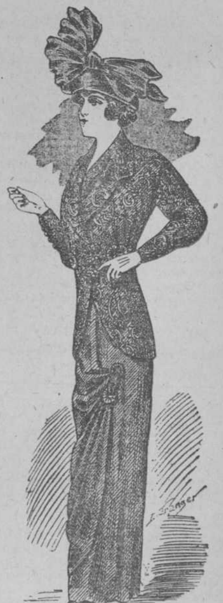
Traje Chaqueta. Eolienne brochado; falda Eolienne lisa, adornos pasamanería. Chaqueta forrada seda, colores moda.

La expresión más selecta en trajes, abrigos, salidas de teatro, chaquetas, sombreros y trajes de soiree pueden verse en brillante exposición en los GRANDES ALMACENES de "LA FILOSOFIA" que es la única casa que en el presente invierno ha recibido las últimas novedades de París. LIZAMA, DIAZ Y COMPAÑIA.