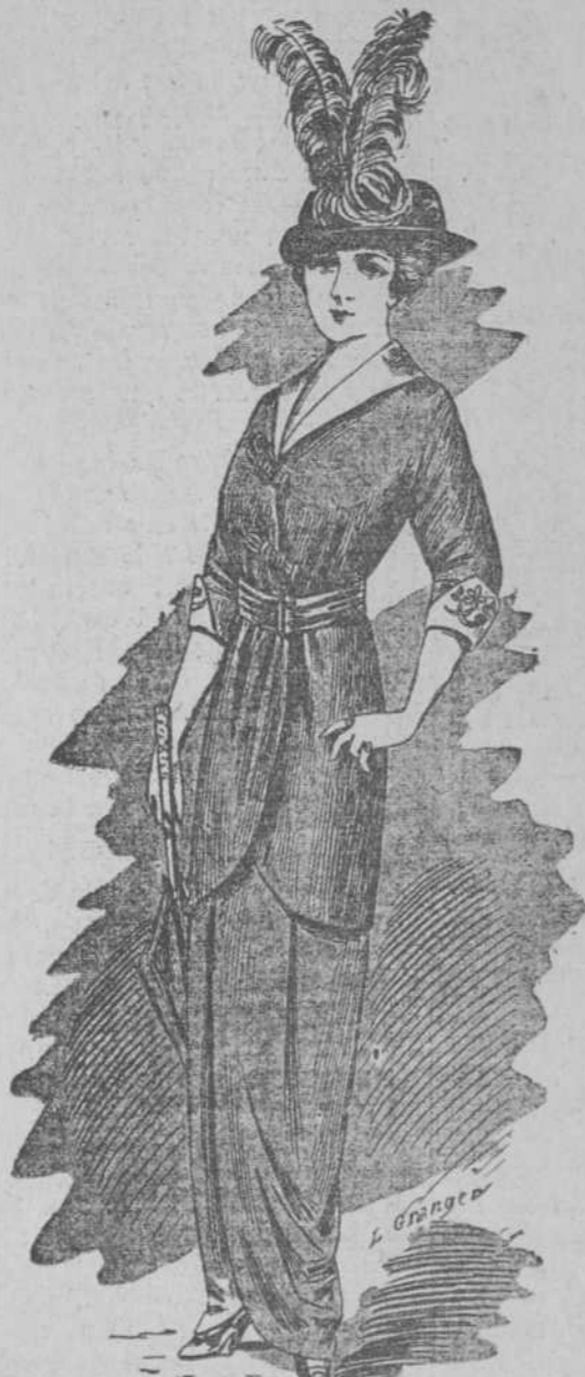
Chaqueta Cachemiré satin lana negro, cuello y bocamangas bordados, adornos pasamanería, forrado seda. Patrón 6. Lo mismo en Eolienne.