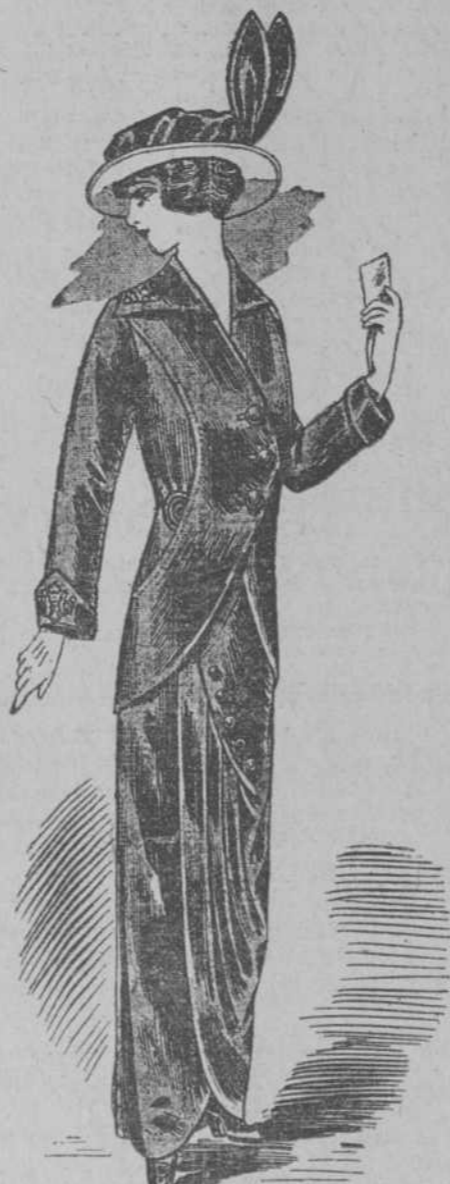
Traje Sastre satin, cuello y bocamangas bordados, colores moda. Chaqueta forrada seda.