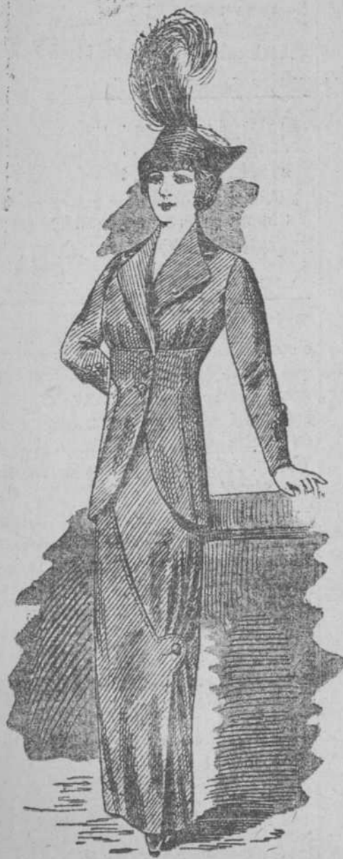
Traje Sastre "Gabardine" lana; cuello y botones de terciopelo, colores moda. Chaqueta forrada selec.