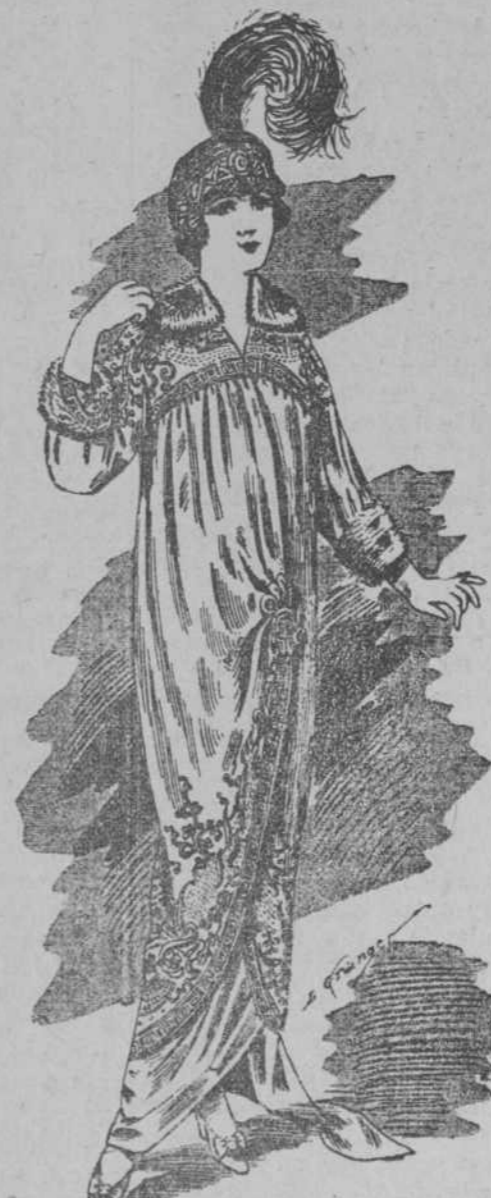
Manteau chio en satin de lana, adorno bordado a mano; y guarnecido piel petit gris, colores nuevos, forrado todo seda.