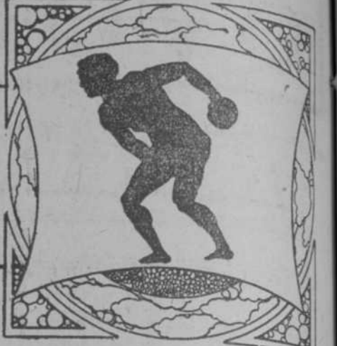
Por Ramón S. de Mendoza