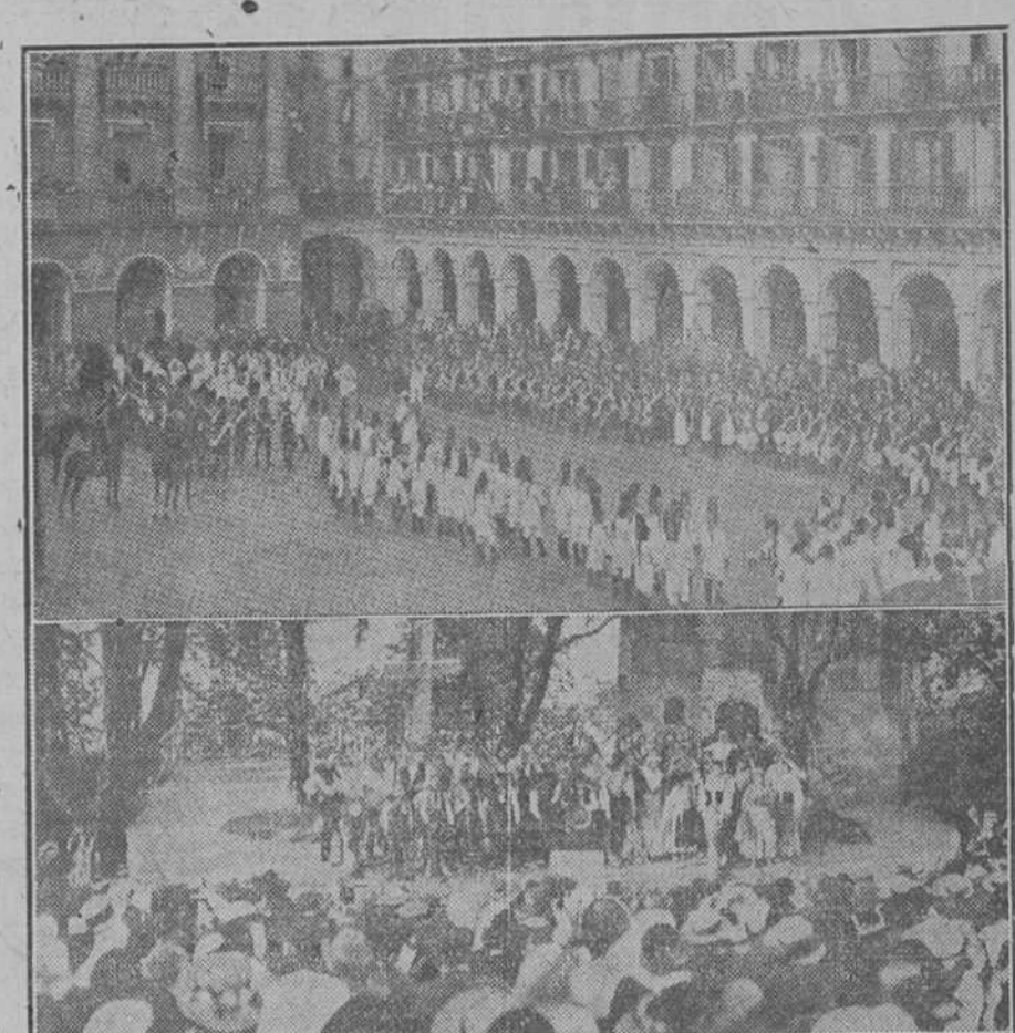
DOS NOTAS VASCONGADAS.—1o. La cabalgata histórica efectuada en San Sebastián festejando el Centenario de la espléndida ciudad. 2o. El teatro vasco al aire libre en Hendaya durante la representación del drama "Maytena."