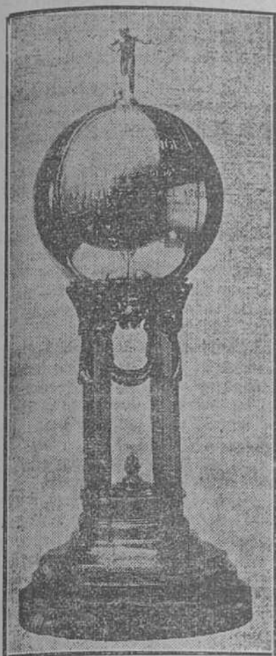
Trofeo del Campeonato Nacional de U.S.A. Este hermoso trofeo ha sido donado a la "United States of America Foot Ball Association" por el conocido sportsman escocés Sir Thomas Dewar.

Ayer tarde quedó acordado el programa definitivo. La fiesta dará comienzo a las tres de la tarde. Asistirá el señor Presidente de la República. En las regatas de canoas competirán cinco de éstas.