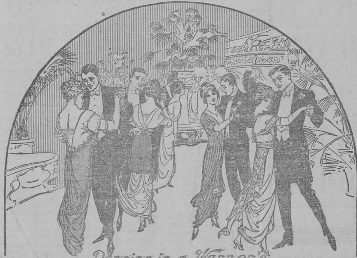
Dancing in a Warner's

SU CONFECION ESMERADA. SU PERFECTO CORTE Y SU FLEXIBILIDAD. LO COLOCAN POR ENCIMA DE CUALQUIER OTRO CORSE.