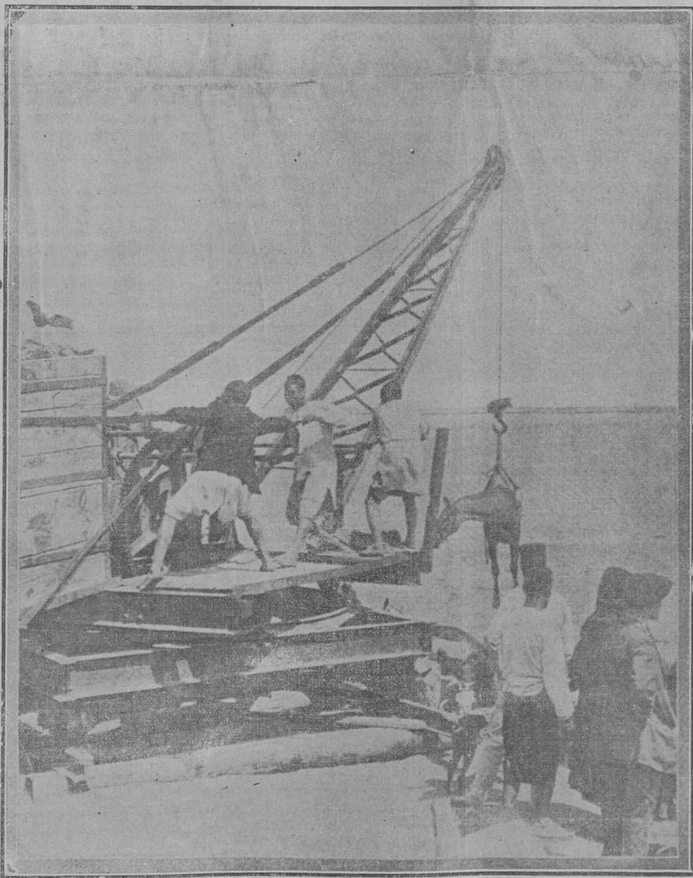
Desembarco de tropas en Marruecos