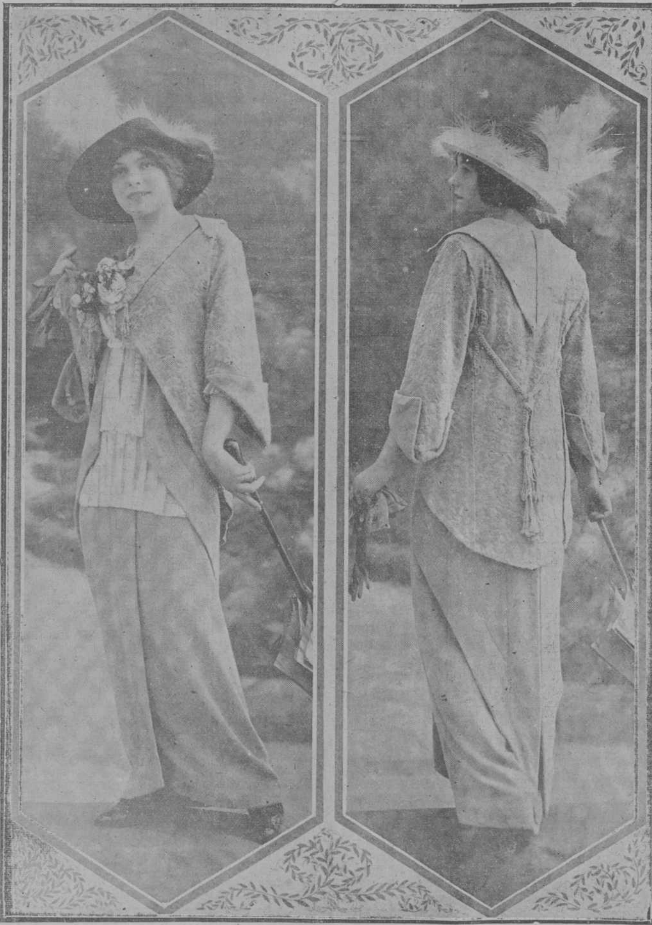
Modelo de calle ultimamente exhibido en París