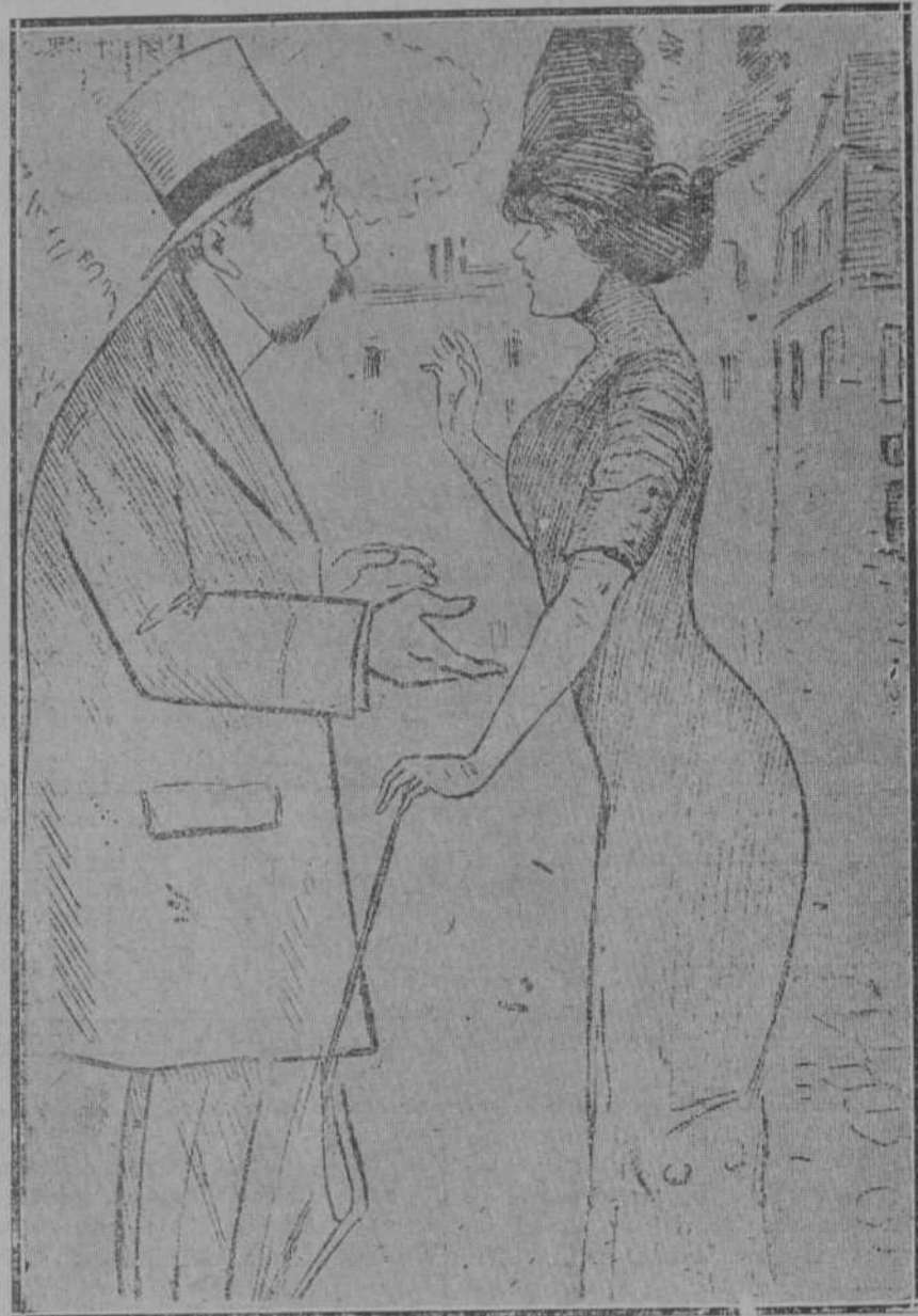
—¿Cómo se atreve usted a decirme tales horrores de mi mejor amiga? —Pues queda aún lo más grave. —¡Ah! Entonces, siga usted.