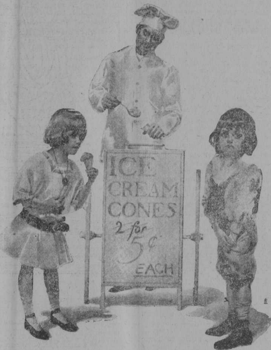
El problema de la vida cara afecta a todas las clases... y a todas las edades.