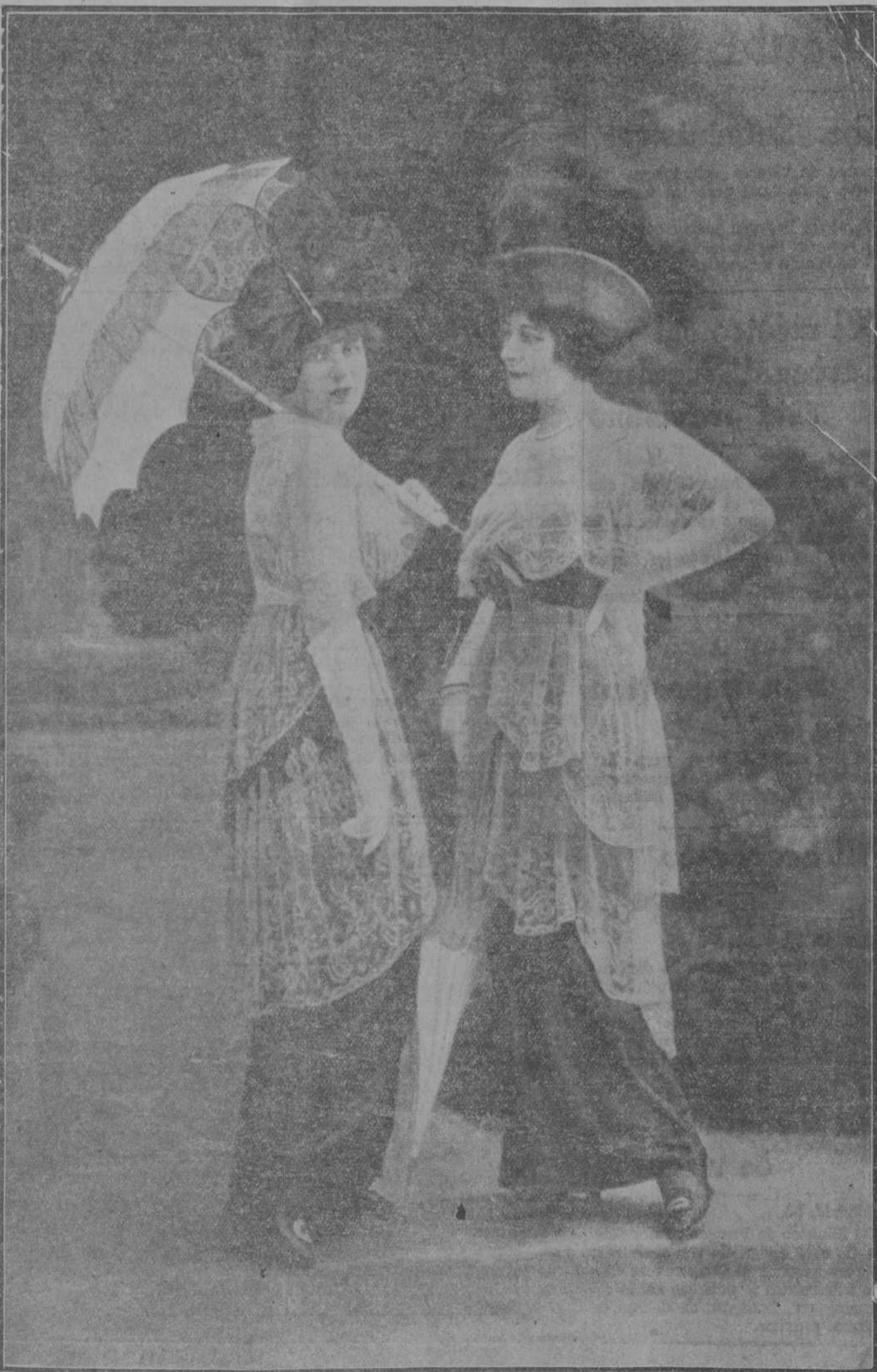
Modelos elegántimos de la casa Drecoll.

to presta a la belleza un marco que realiza su valor. Bajo el velo compacto y limpio de coquetonas motitas, los ojos tienen un encanto más dulce y la boca muestra su frescura. Engrandecida de negro, sin el brillo de ninguna joya en el busto, y sin cintas ni flores, la mujer enlutada no tiene otros adornos que aquellos exquisitos que le prestan los reflejos de sus cabellos, el resplandor de sus miradas, la rosa de sus mejillas. Nada hay en su tocado que rivalice con ella misma. Y de esa tristeza emana una seducción especial. La palidez del perfil se recorta delicadamente sobre el negro. En medio de los tules livianos, los rizos de cabellos parecen más finos. El tallo es más esbelto, los contornos del cuerpo se dibujan con ondulaciones mayores, y el ritmo general, silencioso y calmado, añade al armónico conjunto una nueva gracia.