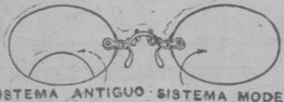
SISTEMA ANTIGUO - SISTEMA MODERNO

Si Ud. ha de tener buena vista ha de usar espejuelos a tiempo. Si los espejuelos han de estar bien graduados a su vista, si han de ser de piedras buenas para que se la conserven, necesariamente han de ser elegidos por los ópticos de