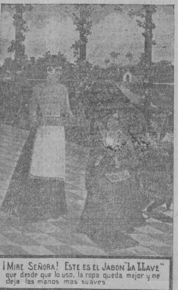
¡MIRE SEÑORA! ESTE ES EL JABON LA LLAVE" que desde que lo uso, la ropa queda mejor y me deja las manos mas suaves.