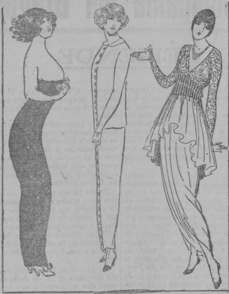
Tres aspectos de la moda del día. (London Mail.)