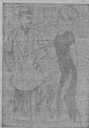
—Sin empargo, doctor, yo sufro mucho... —Sí, la conozco, vuestra afcción... Es joven, alto y rubio. (Jean qui rit, de París.)