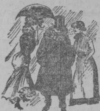
En el invierno las muchachas a quienes echo chibicos me scourten.