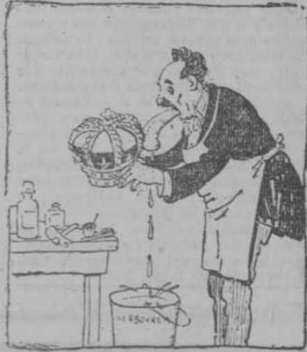
Se reforman toda clase de objetos, por viejos y usados que estén. Especialidad en dar brillos y lustres. (España Nueva, de Madrid.)