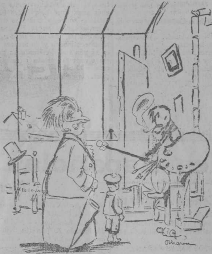
—Maestro: el niño está debilitado; acaba de pasar el surampción. Así, le ruego que en el retrato aparezca con un aspecto más saludable. —Descuide usted, señora. Emplearé aceite de hígado de bacalao. (Rire, de París.)