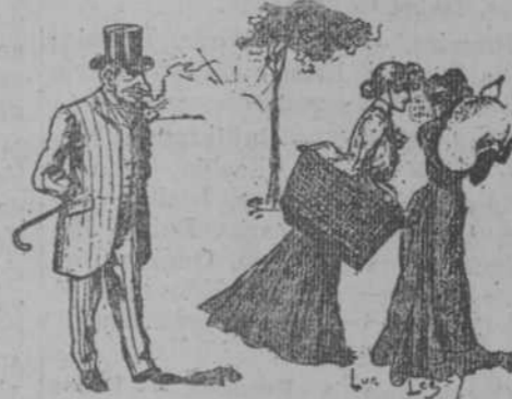
—Es para volverse uno loco... y en el verano huyen de mí como si les causara miedo. (Frou-Frou, de París.)