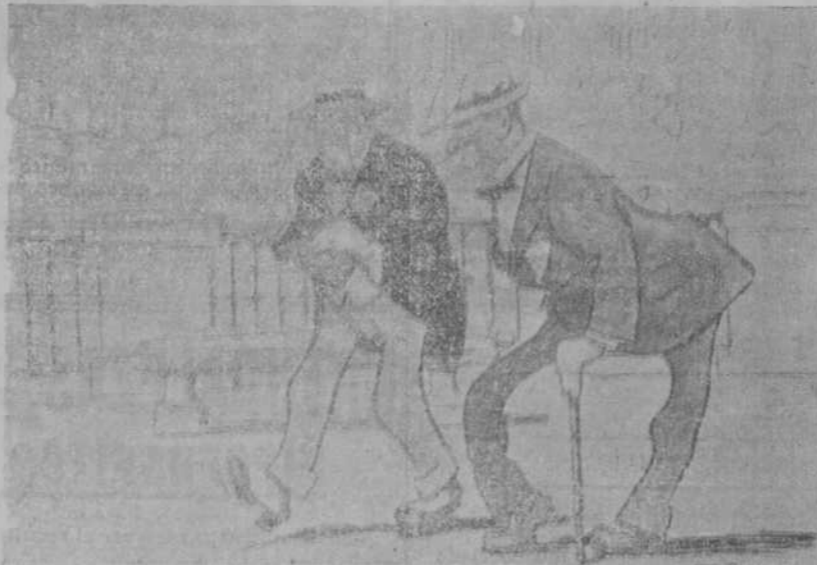
—Quedamos, señor Conde, en que no se va nada... —¡Ni a tres tirones! (Gacón, de Madrid.)