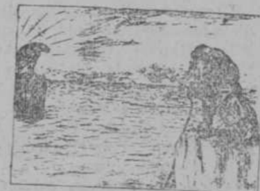
EL AGUILA AMERICANA.—Hace cien años justos que vivimos en paz, compañero. EL LEON BRITANICO.—Sí, pero ¿podremos celebrar otro centenario como este de ahora, después de abierto el Canal de Panamá? (Picture Politics, de Londres.)