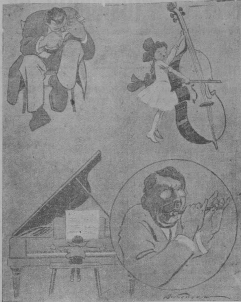
Incongruencias musicales (Puck, de Nueva York.)