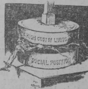
Pulverizando a la clase media. (Life, de Nueva York.)

Así se comprende que no solo la Corte y los cortesanos, sino que también una parte no pequeña, de la población de Madrid, busque aún en La Granja el sitio apetecido para los meses de verano. Tiene, sobre todos sus encantos, la comodidad de la cercanía; con tres horas de cómodo viaje se está instalado en lugar confortable, fresco... y divertido. Porque ha venido a ser La Granja uno de los sitios en que se organizan más fiestas y diversiones. No dejemos de hacer notar la circunstancia de que el veraneo en este sitio tiene siempre un marcado tono de aristocratismo, un aire peculiar, inconfundible, de severa elegancia. Tanto, que algunas familias gustarían de ir a La Granja, y lo rehuyen por esquivar las obligaciones de una vida cortesana.