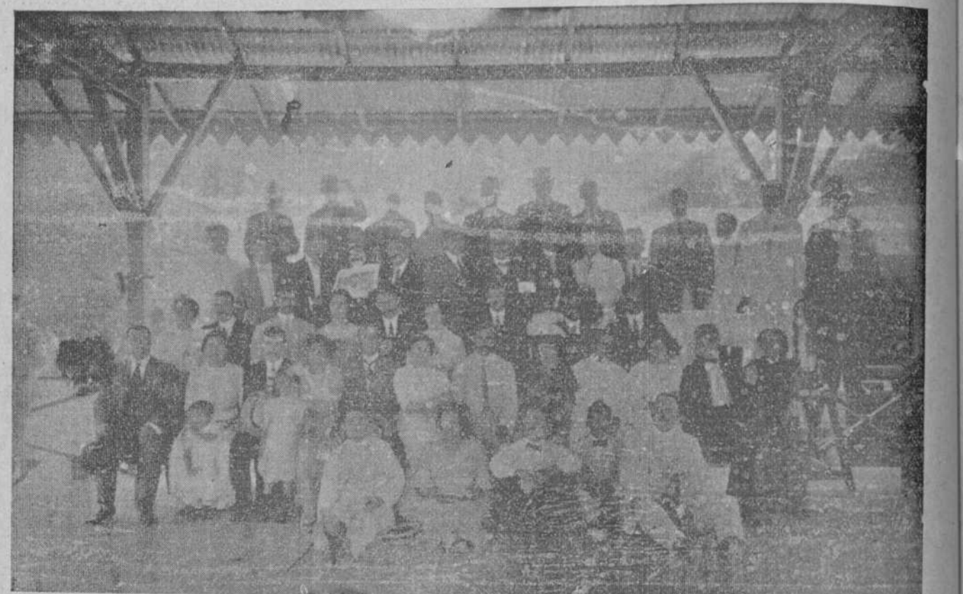
Grupo de concurrentes a la jira celebrada por la "Alianza de Villamarín" en la quinta "La Bien Aparecida"

Los gallegos de Villamarín son gallegos muy amantes de la tierra natal. La veneran y la honran en Cuba laborando; de cuando en vez se reúnen para dedicarle un recuerdo cariñoso celebrando una brillante fiesta. Ayer tuvieron su gran día los de Villamarín.