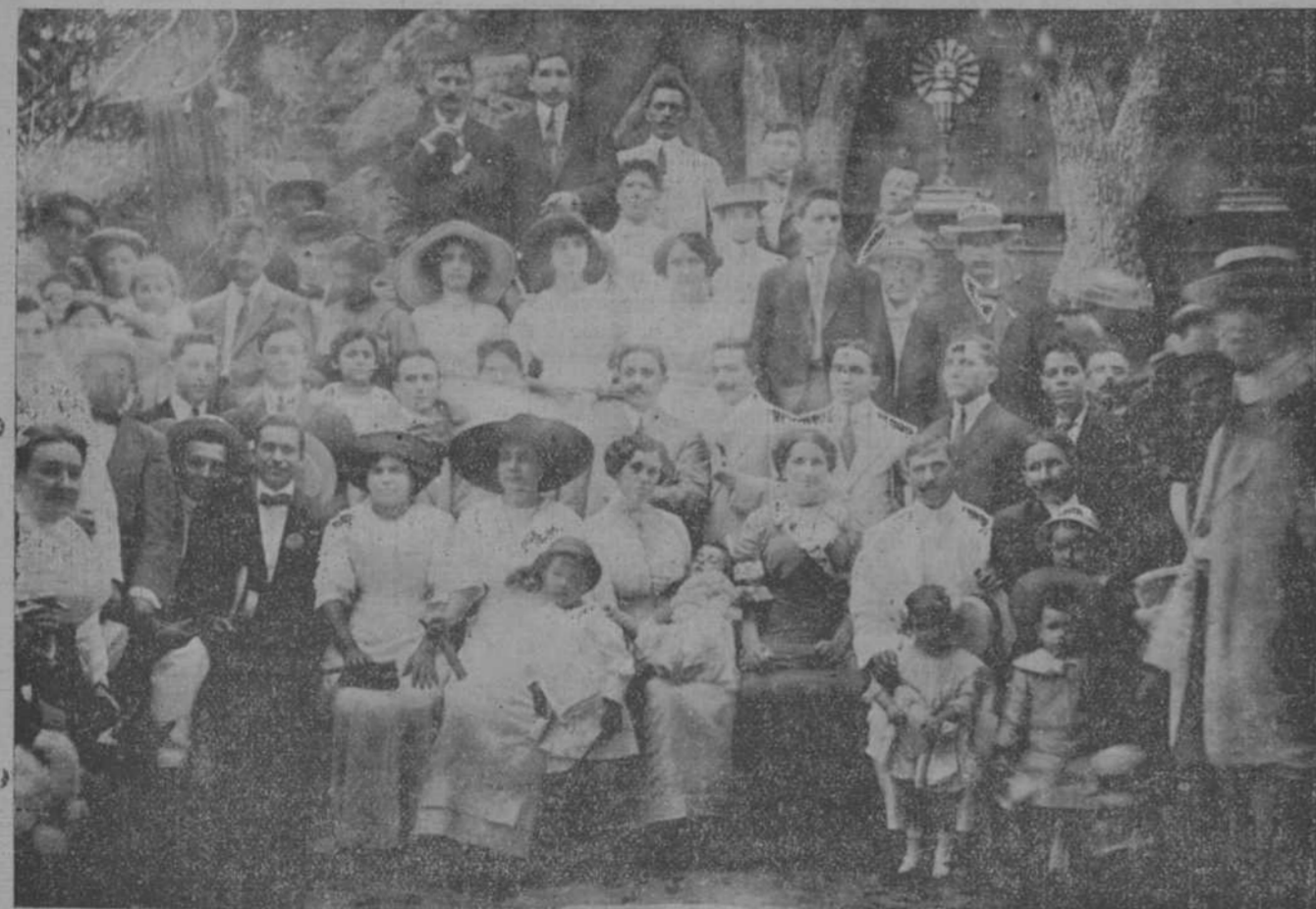
Un grupo de concurrentes a la Jira de Los de Boal en Palatino