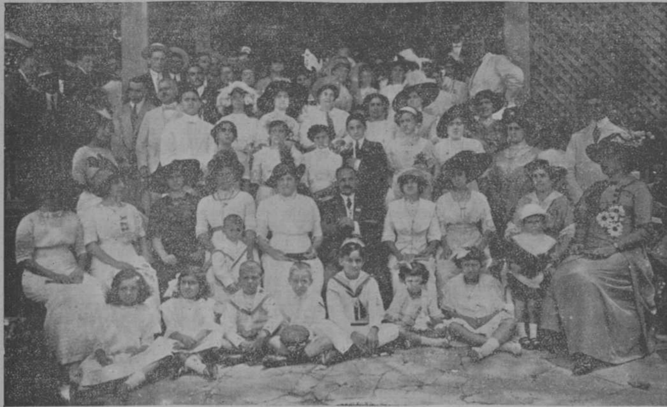
El Presidente del Club Coruñés y un grupo de asistentes a la Jira en Palatino

Fuó huésped distinguido de la muy noble y muy heroica ciudad de la Coruña muy cerca de cuatro meses. Trasládomos a la ciudad gentil en un caque miserable y conservador como todos los caques y con motivo tan doloroso mi vida coruñesa fué de alegría, de ensueño, de amor.