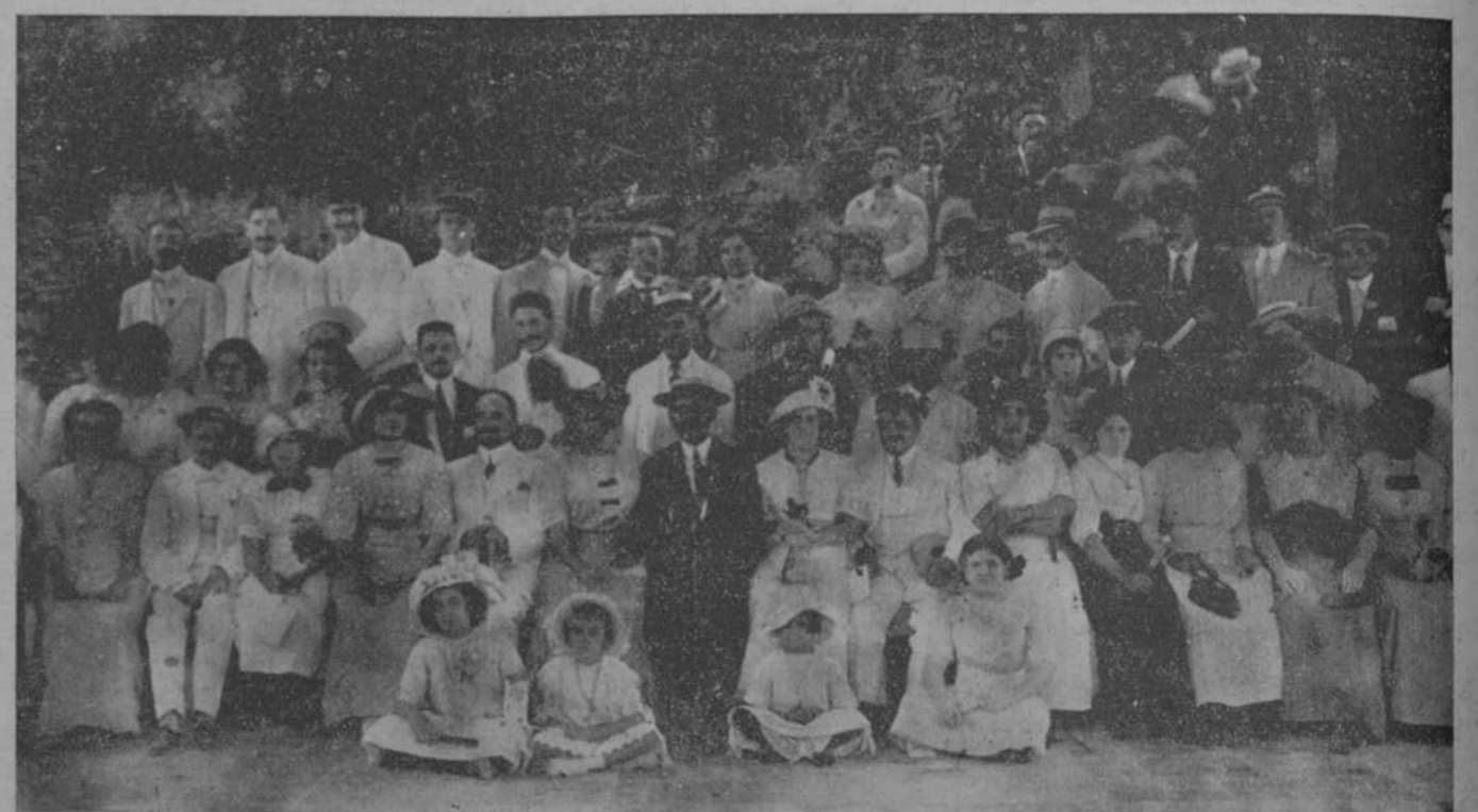
La Sección de Recreo y Adorno del Centro Asturiano y algunas damas que asistieron al almuerzo ofrecido ayer en el "Templo Indio"

Desde el mamonecillo abuelo marchamos al solemne templo indio, que por obra y gracia y donaire del artista Magriñat se levanta en uno de los pináculos más altos del jardín de las fiestas dominicales. Cantaba una orquesta y bailaban varias parejas.