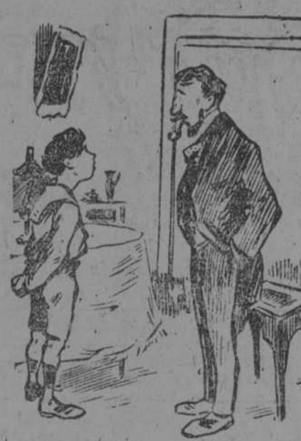
—Papá, ¿qué son billetes? —Todo lo que se cae y se rompe cuando uno entra en casa de noche y busca los fósforos a tientas. (L'Amour, de Paris.)

momentos; y cuando subió a la Cátedra Sagrada el P. Lorente, la expectación fué grandé, dada la fama de elocuente orador que el sabio sacerdote tenía, y que se vió comprobada por manera cumplida en el curso de su hermosa oración.