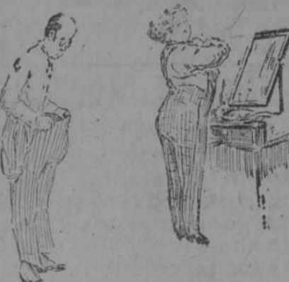
—Dime, María, ¿Es que estoy ensuciando o que me he puesto unos pantalones tuyos? (Life, de Nueva York.)