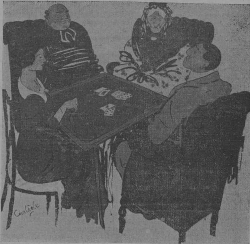
—Ella es de muy buena familia. En 1012 aparece ya en las crónicas un Hacquart d' Houdeville que en la toma de no se qué ciudad hizo ahorcar a todos los habitantes. (Sourire, de Paris.)