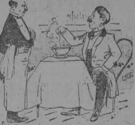
—Diga usted, mozo; ya que se ha inventado la telegrafía sin hilos, ¿no se podría conseguir inventar también la sopa sin pelos? (Frou-Frou, de Paris.)