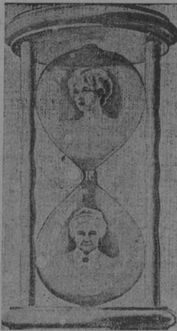
Las arenas del tiempo. (Life, de Nueva York.)