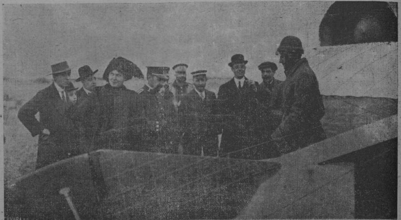
El Infante de Orleans, aviador, en los momentos en que regresaba de uno de sus vuelos en el aerodromo de "Cuatro Vientos," Madrid.

El campeón logró matarla; pero ha perdido en la lucha un dedo de la mano derecha.