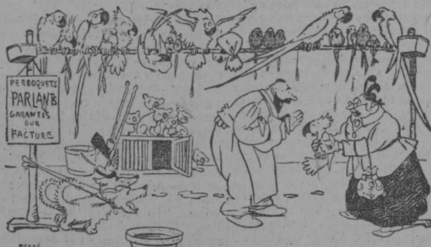
—Le devuelvo a usted el loro. No entiendo una palabra de lo que dice. —Eso no puedo remediarlo yo, señora. Usted me ha comprado un loro de Java... Pues con aprender el idioma javanés ya está resuelta la dificultad! (Sourire, de Paris.)