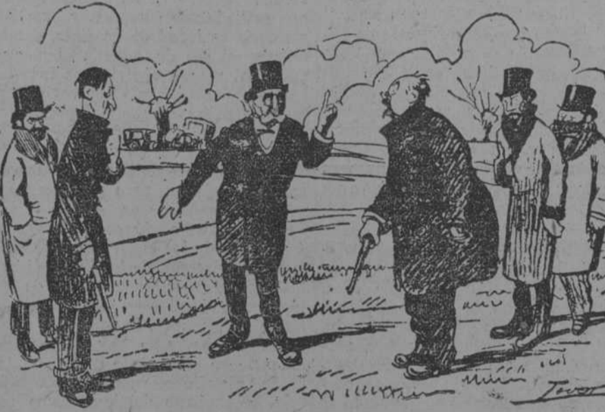
—Señores, tengan ustedes mucho cuidado de no matar a ningún aviador.