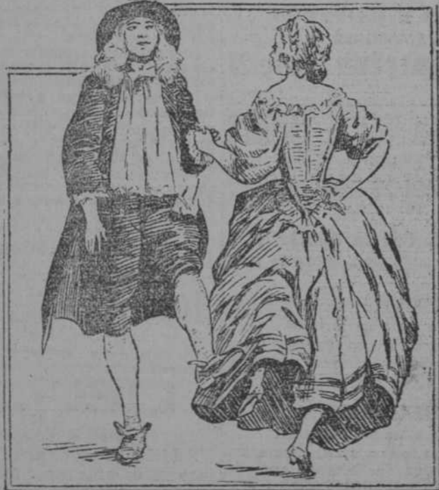
LA BOI RREE

En todas las estaciones termales, los baños de mar, los puntos de montaña, las temporadistas están formando "cours de danse," clases de bai-