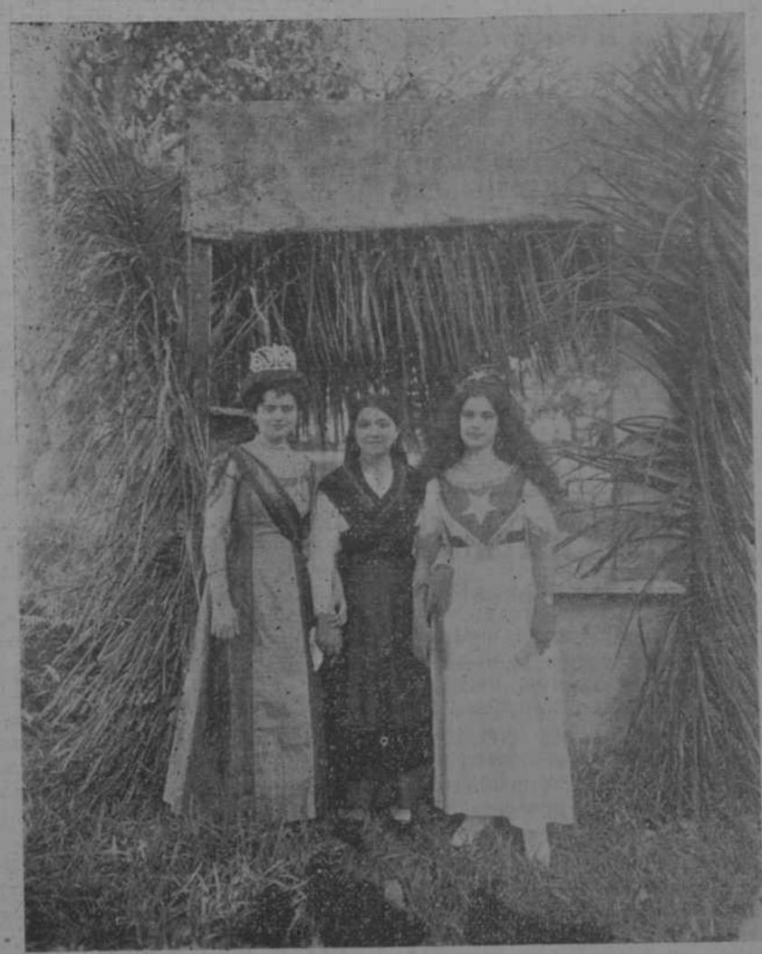
UNION BARCALESA: LAS TRES REINAS

Ayer celebraron los barcaleses entusiastas su gran día; su fiesta a pesar de haber sido suspendida el domingo pasado por consecuencia del mal tiempo, resultó brillantísima; en aquellos lindos jardines, en aquellos prados de verde primoroso cantaron, banquetearon y bailaron en honor de la tierra y se abrazaron en abrazo muy tierno y muy cordial los barcaleses.