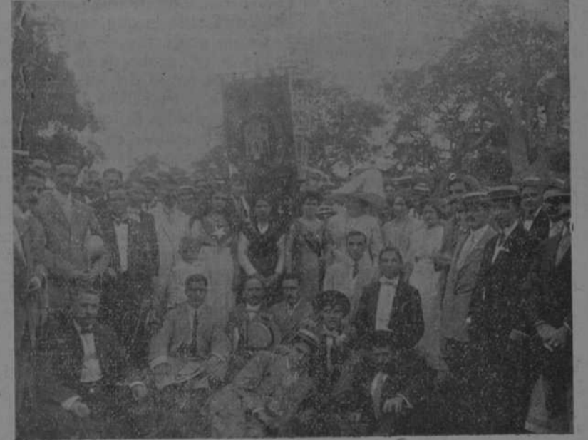
GRUPO DE ROMEROS; EL ESTANDARTE Y LAS TRES REINAS