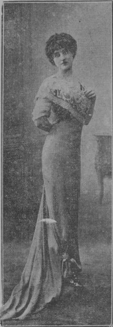
Este elegante vestido de tarde es de charmeuse sauce; va abierto en su borde inferior por unos pliegues que levantan el borde, reteniéndolo con artística hebilla. Lleva el cuerpo bordado. Es modelo de Redferm.

Habiendo ascendido al trono, el lujo de la Reina tomaba cada día mayores proporciones. A pesar del mal estado de la hacienda real, estrenaba un magnífico traje á diario y llegó á deber á su modista la fabulosa suma de 300,000 francos, cantidad que en aquellos tiempos tenía mayor significación de la que tendría hoy.