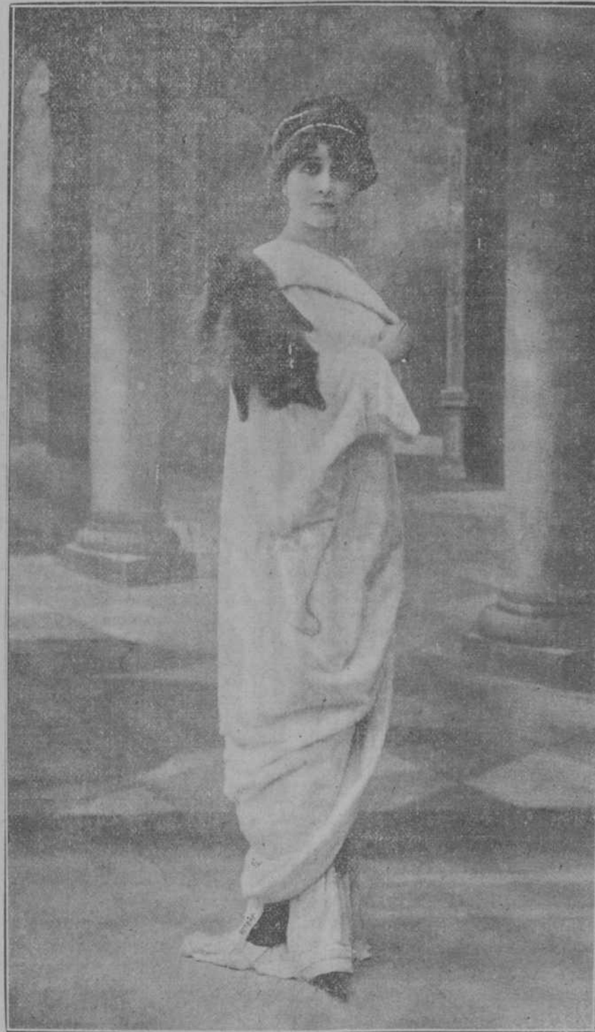
ABRIGO DE HERMINE, POR DRECOL

Ya está terminada la vidriera, lectoras queridas. Sin necesidad de que yo encomie su belleza, os habreis hecho