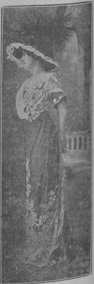
Traje de comida, por Martial y Armand.

"El dios un tanto confuso por el clamoreo de aquellas mujeres, las ofreció todo género de compensaciones: "¿Queréis caza?"—No; queremos la muerte. "¿Queréis frutos?"—No; queremos la muerte. "¿Queréis adornos?"—No; la muerte, la muerte y la muerte.