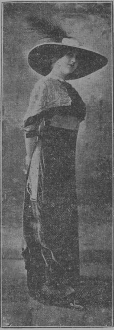
Traje de tarde, por Martial y Armand.

Este vestido es de terciopelo flexible color bronce; lleva ancho cinturón gris y el cuerpo bordado de seda gris de tonos suaves.