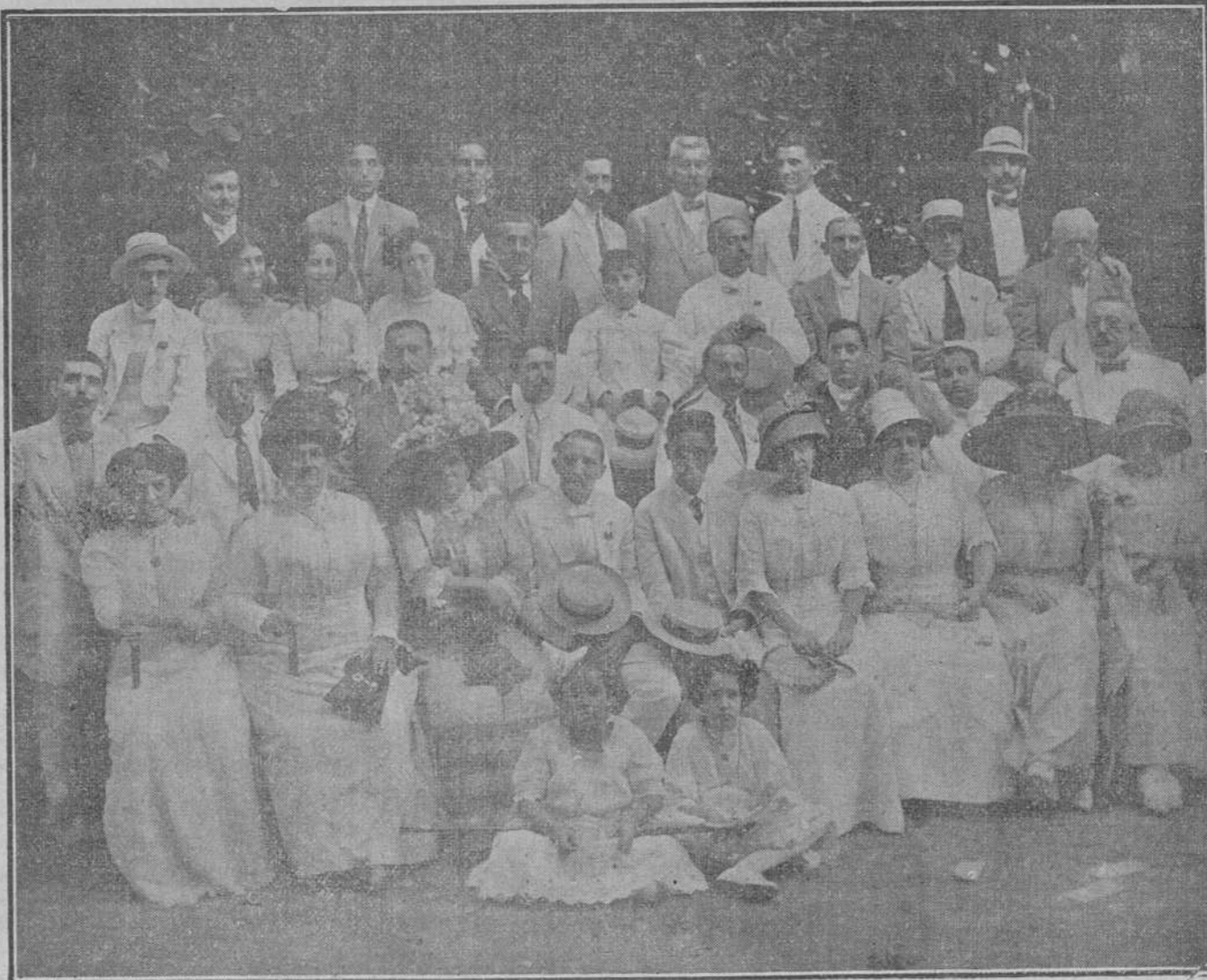
ROMERAS Y ROMEROS

Hemos llegado á las puertas del jardín donde la fraternidad avilesina será el encanto de unas horas. Aquel hombre alto, recio, formidable, de la amplia banda de cuero, el genio vigilador del oloroso vergel, campo donde batallarán las flores, el amor y los claveles, va conteniendo á los romeros y muy amablemente va dándoles paso sin que se conmueva ni se inmude. Parece el carcelero de un Rey. A nosotros llega el rumor confuso de la gaita que flora su destierro, de las blandas orquestas, que dicen súplicas de amor, de las risas y los deciros que baten allá bajo la sombra amable del mamoneo abuelo, abuelo y romántico. Pasamos. Por los caminos van las parejas recogiendo las flores de la promesa.