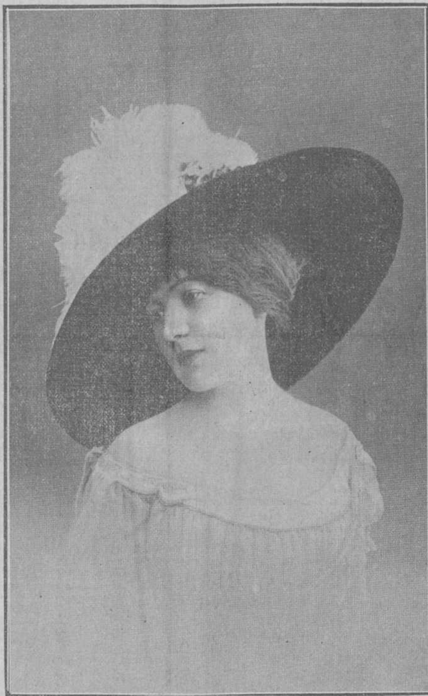
Elegante sombrero de estación todo de paja negra con penacho delantero de plumas blancas, cogidas con broche de flores.

Para no gastar el dinero en medicinas se debe gastar en la cerveza de LA TROICAL, que es un curalo todo.