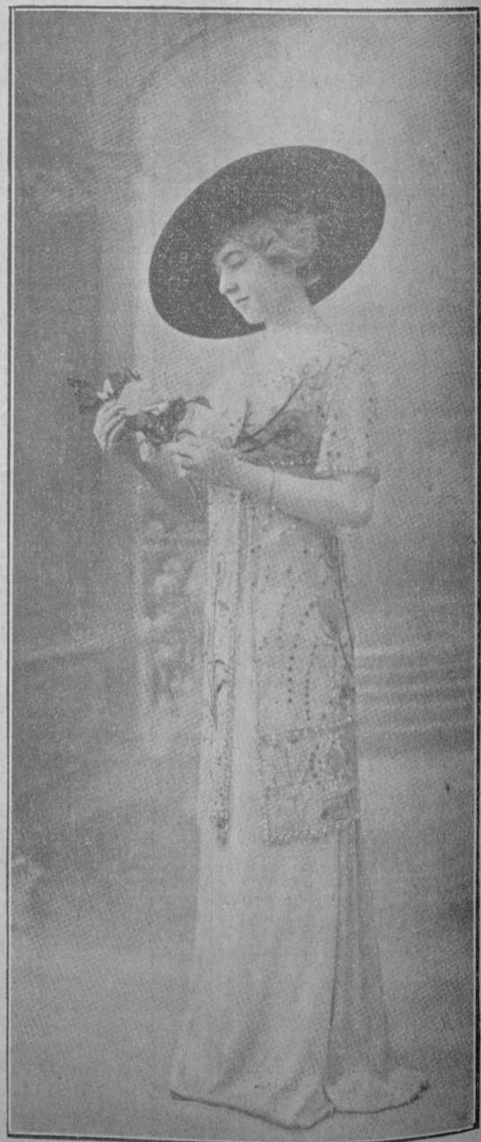
Traje de gasa blanca, bordada sobre fondo color albaricoque. La túnica es toda de encajes legítimos.

Consérvense algunas medallas de esta emperatriz, con el busto de Nerón en el reverso, y todas ellas son de bronce grisera. Parece que Poppea la primera romana que usó el velo para resguardarse del sol; y era tal el finamiento de su lujo, que se bañaba en leche, á cuyo efecto tenía siempre á su disposición en las caballerías de quinientas burras.