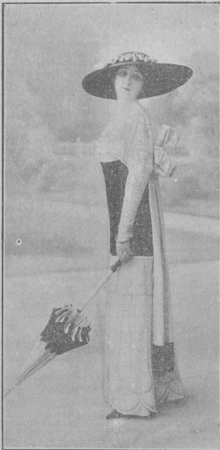
Traje de linó de bordado inglés. El cuerpo va guardado de encajes y la coraza es de terciopelo negro.

provocado su tesis; los caricaturistas han encontrado un filón afortunado y la sociedad rica comidilla para la charla de los salones.