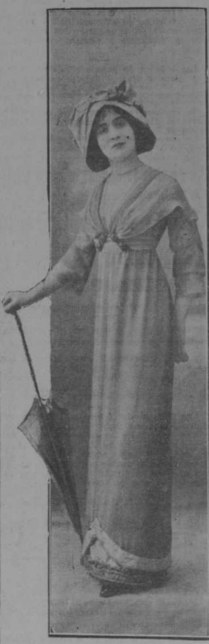
Caprichoso traje de tarde para tiendas ó paseo, modelo Premet.