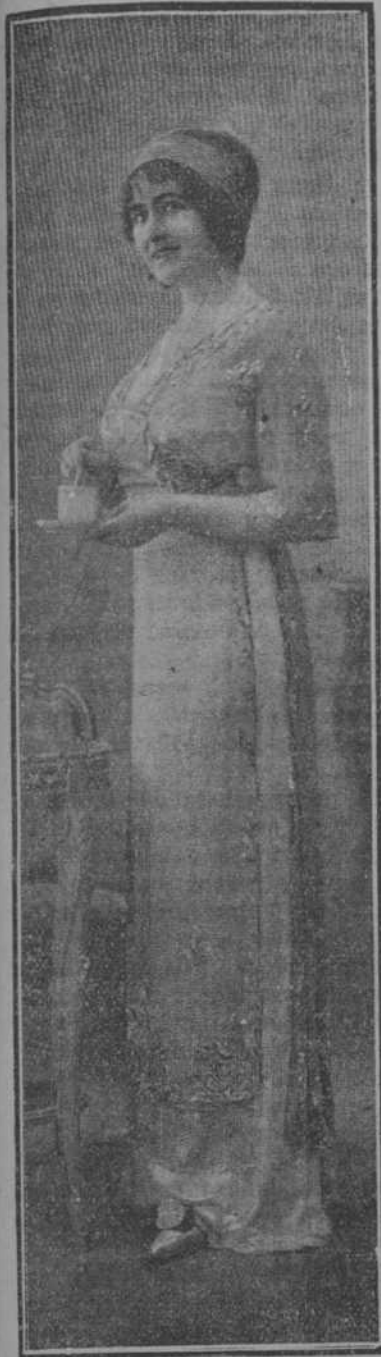
Magnífica toilette, cuya sobrefalda es de gasa bordada en cristal. Esta creación, de Buzenet, ha llamado mucho la atención.