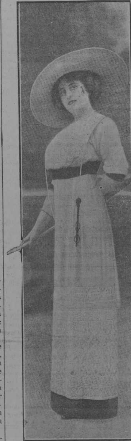
Traje de paseo, color violeta, con el peto y la parte baja de la falda de magnífico encaje, modelo Doenillet.

de dicha Catedral, ha bordado y regalado para la cripta de la Almudena la cortina del fondo del manifestador y la del Sagrario. Está la primera bordada en oro sobre raso blanco, con dos franjas de palmeras románicas, cuyas hojas van bordadas con puntos distintos y matizadas con oro brillante y mate. El fondo queda salpicado de flores de lis. La cortinilla del Sagrario es también de seda blanca, bordada en oro y sedas de colores. En el centro se destaca un escudo azul con la cifra IHS y la corona; arriba y abajo, la leyenda Eccc panis angelorum , y en los ángulos las espigas y las uvas, símbolo del Sacramento.