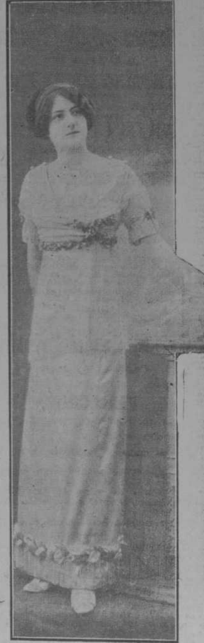
Caprichoso traje de soirée, modelo Bernard.