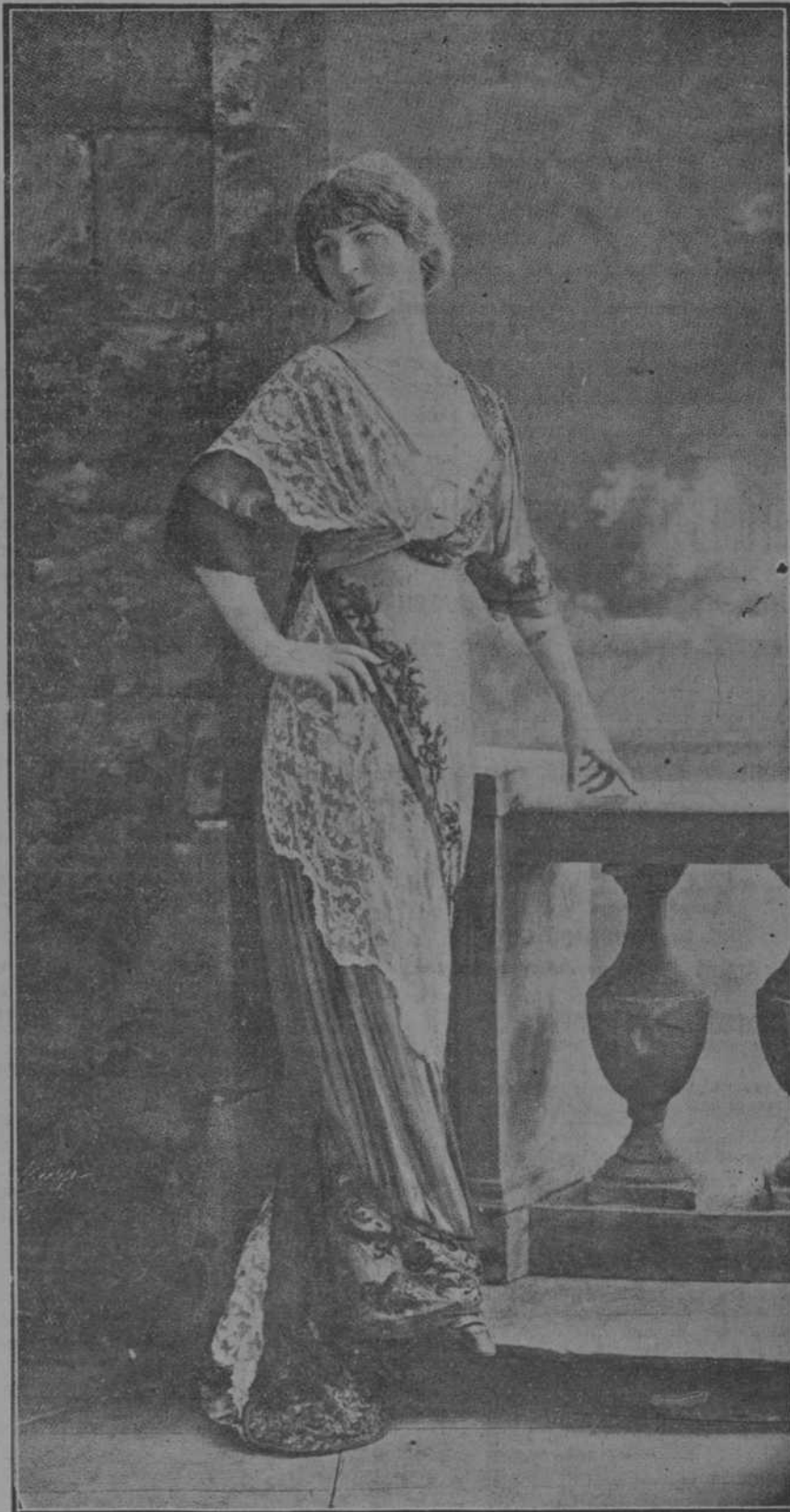
Bonito traje de estación, de muselina de seda gris, con bordados negros y encajes, creación de la casa Drecoil.