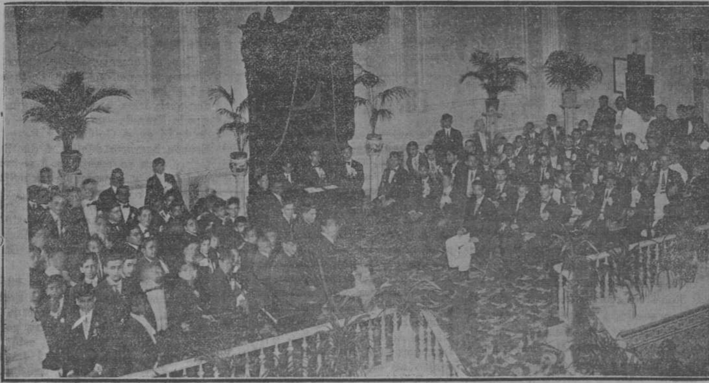
LOS ALUMNOS PREMIADOS

En la propia Habana tendrán, muy en breve, otra iglesia y otra escuela: en la Calzada de la Reina: doscientos cincuenta mil pesos más... Y no se diga que los jesuitas laboran solo para sí, construyendo iglesias y abriendo escuelas. Los observatorios de Cienfuegos y de Belén, y la Estación Seismográfica de Luyanó, única en Cuba, para la República son más que para ellos. ... .. ¿El observatorio! ¿Puede haber un encanto mayor para un poeta que un observatorio?... Los observatorios son las fortalezas de la ciencia. En ellos, que suelen re-