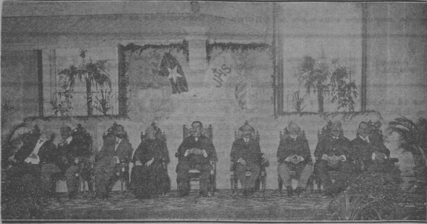
LA PRESIDENCIA DEL ACTO