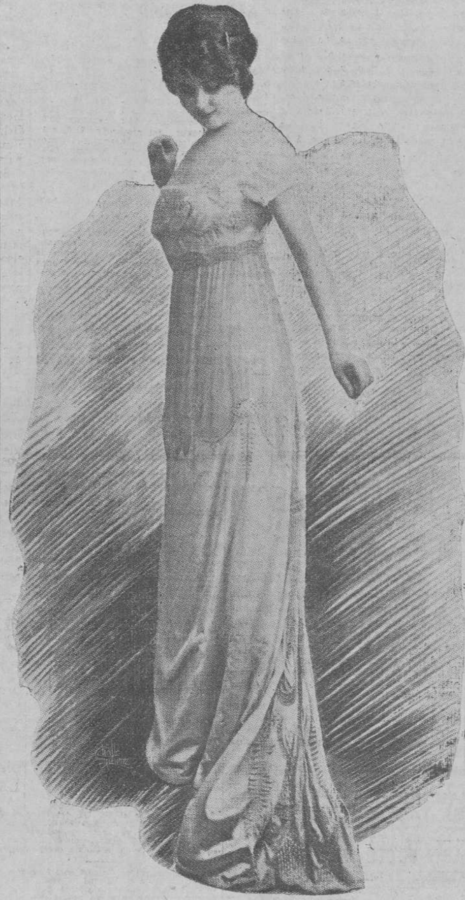
TRAJE DE CASA BLANCA TOTALMENTE PLISADO. El bajo del vestido es de terciopelo guarnecido de un bordado con perlas. El cuerpo, de talle corto, es también de terciopelo blanco bordado con perlas.