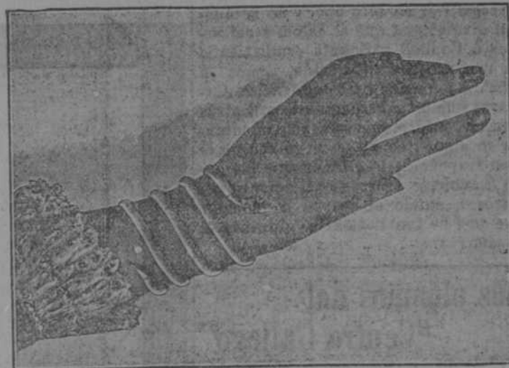
Pulsera serpiente en oro solo.