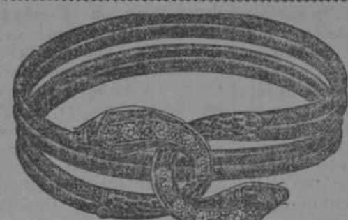
Pulsera serpiente, en oro, con brillantes y piedras de co- lores.

Longines extra-planos, en acero, plata, plata nie- lé y oro, para caballeros. Admirables cajas con es- maltes, muy finos