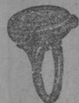
SORTIJA RELOJ Verdadero capricho

Brillantes, Zafros y Rubíes EN grandes partidas