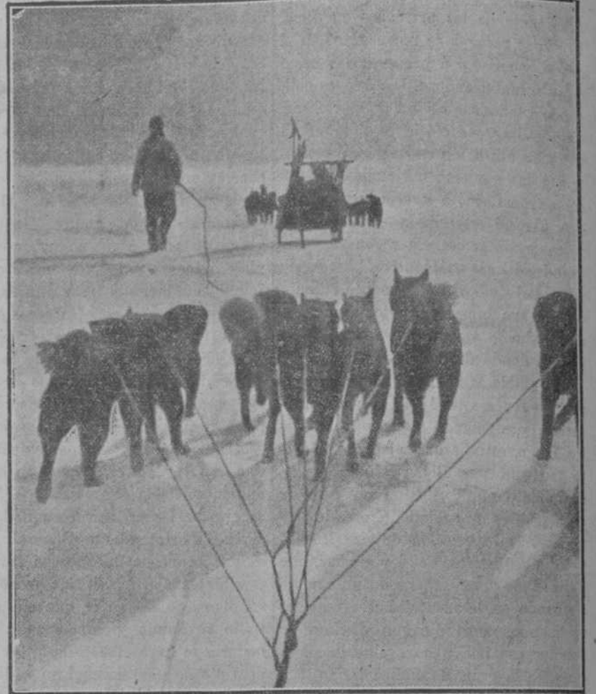
¡Hacia el norte!—Instantánea tomada desde el segundo trineo

rocas y sobre las nieves, sus flechas pálidas. Pero muy pronto la alta cima del cabo Bergendahl recibirá su beso supremo, y las sombras de la prolongada noche se extenderán sobre aquellas horribles soledades ha-