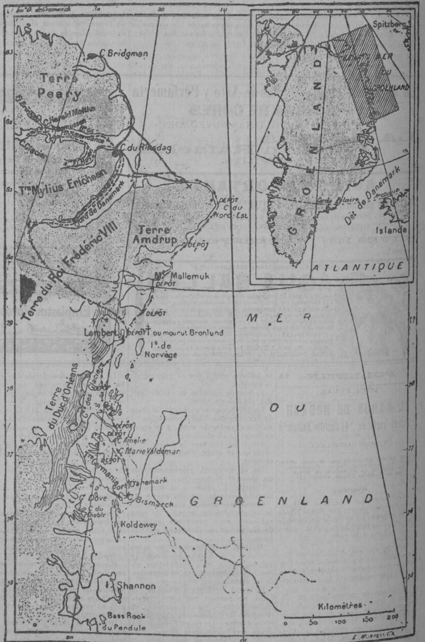
Mapa de la región de Groenlandia explorada por la expedición del "Danemark."