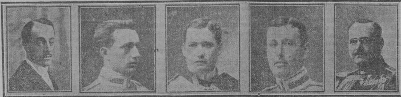
Conde de Montijo