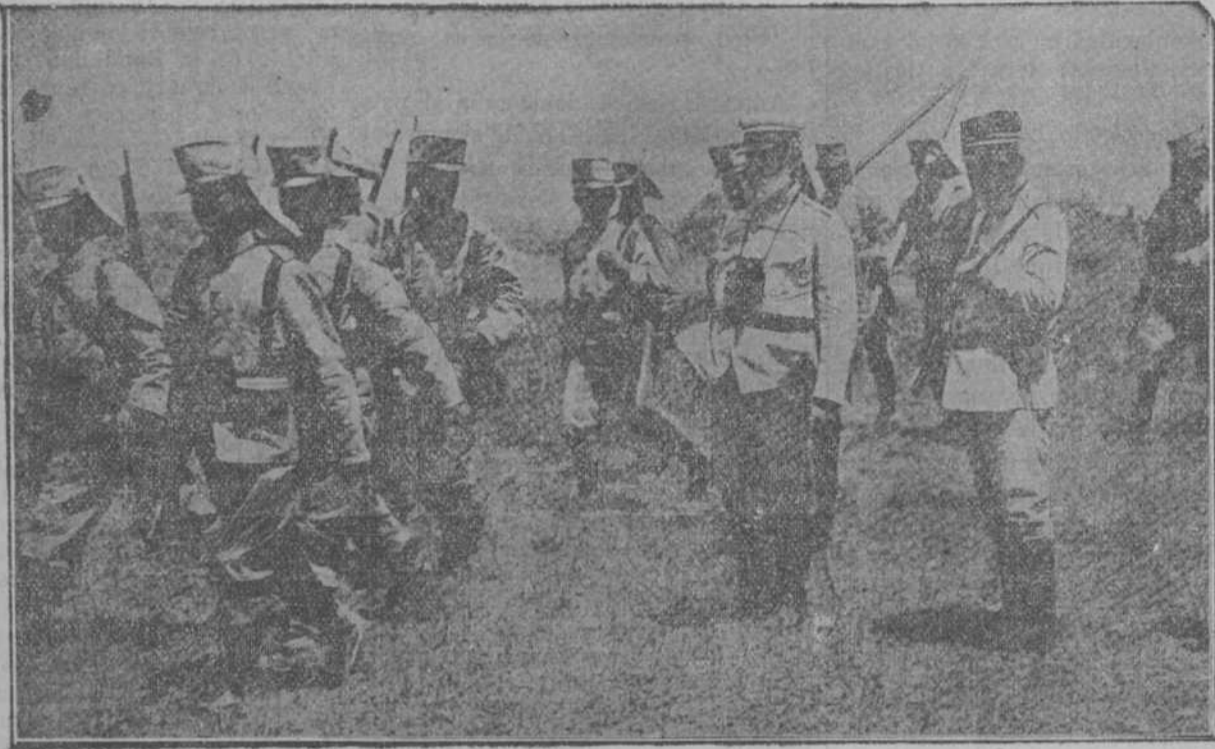
El general Marina en la línea de fuego disponiendo un avance hacia el enemigo.

—Me han dicho que haga relación de los sucesos en que intervine el otro día, y la traigo á estos señores.