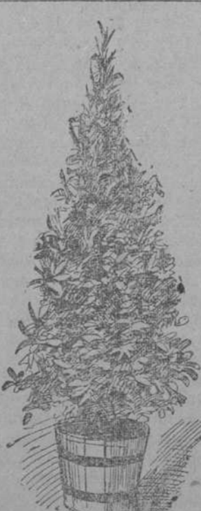
BAY TREE PYRAMID.