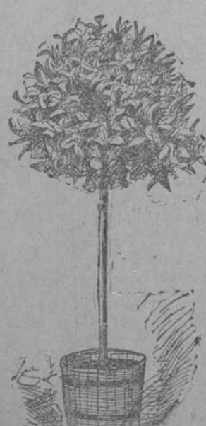
BAY TREE, STANDARD.