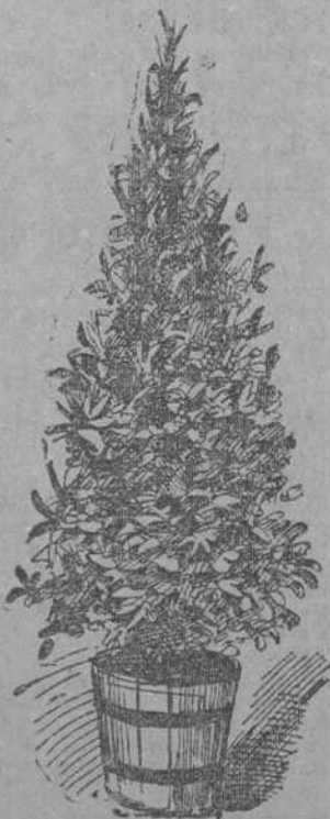
BAY TREE PYRAMID