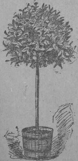
BAY TREE, STANDARD.