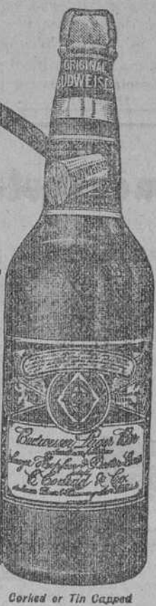
Corked or Tin Capped

GALBAU Y CIA., Distribuidores, Habana, Cuba,