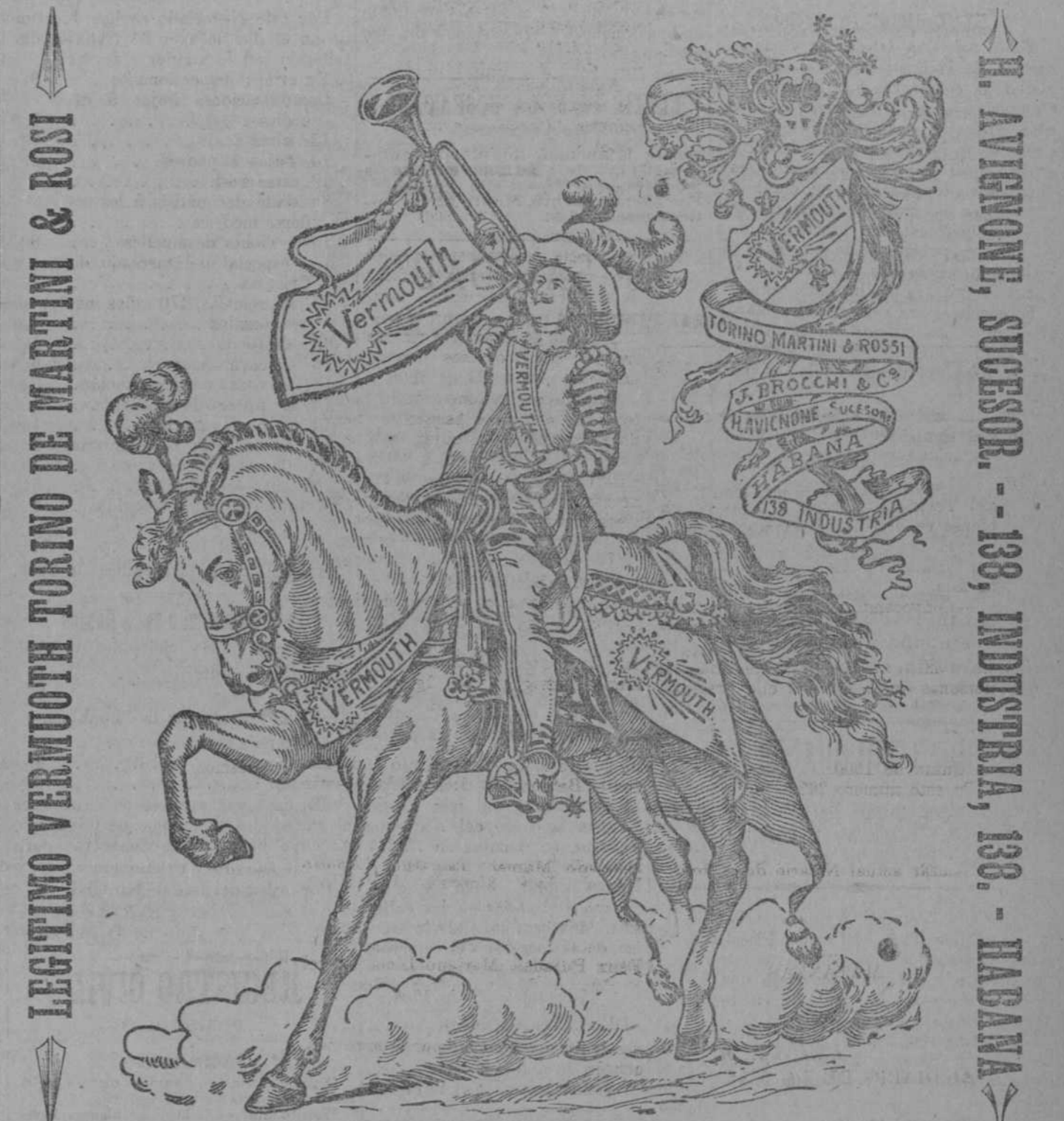
La única marca acreditada en la Isla, la que casi todos los alambiques se probaron á imitar..... en la etiqueta. Cuidado con las bebidas espúreas. Esta casa no tiene sucursal ninguna.