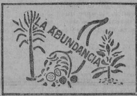
MARCA LA "ABUNDANCIA"

Swift & Company tienen siete mataderos en los principales centros de la industria pecuaria de América. Matando hasta 60,000 animales cada día; los residuos naturales, curados, de esos animales—sangre y huesos—los embarcan para todas las partes del mundo. No nos sería posible mantener ese alto nivel mercantil, si nuestros productos no dieran resultados satisfactorios.