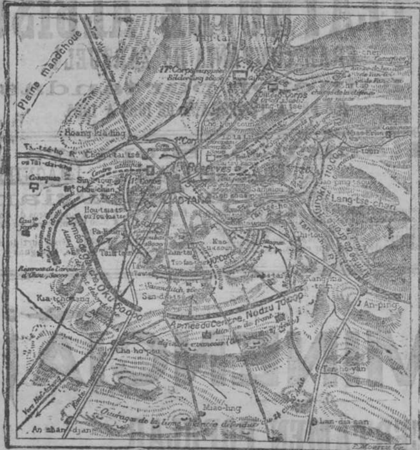
Situation le 31 août. (Ataque générale japonaise.)