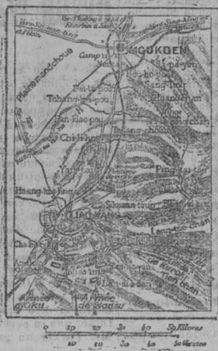
Croquis n. 1