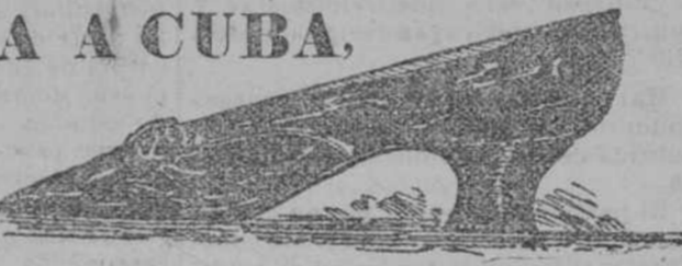
De glacé, de charol, de matiz piel de Nutria, tacón Luis XV y de snela. Precio $ 4.25 y $ 5.30 oro.