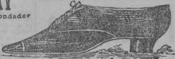
Matiz piel de Nutria, piel glacé negro, tacón regular y bajo. Precio $ 4.25 oro.