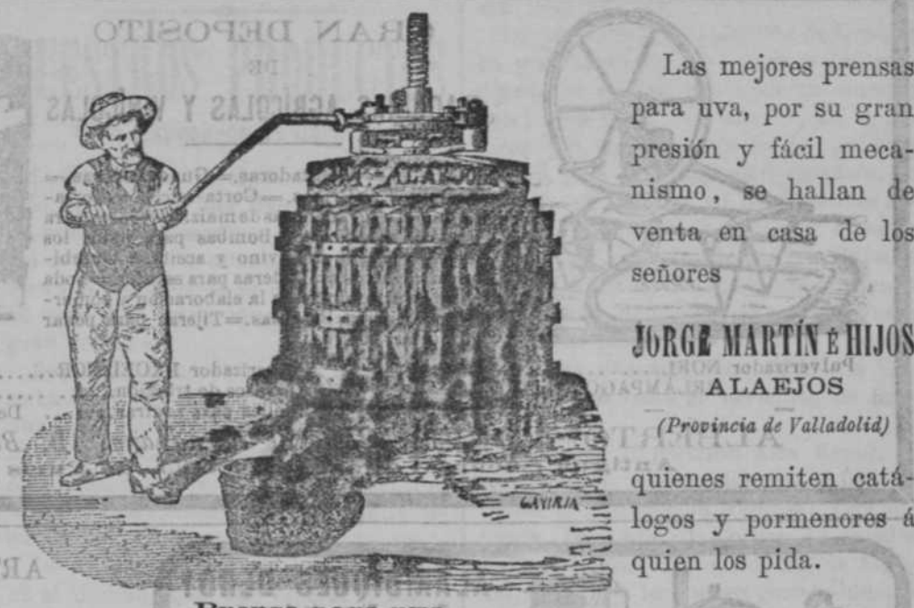
Prensa para uva