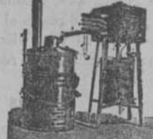
Alambique rectificador basculante, con calienta-rino.—De 90°. Rápidez y economía