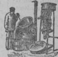
Alambique economizador de agua para destilar Orujos, Haces y Frutas. Facilidad de limpiar.