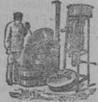
Alambique economizador de agua para destilar Orujos, Hojas y Frutas. Facilidad de limpiar