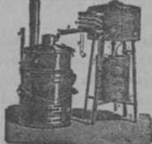
Alambique rectificador basculante, con calentamiento de 80°. Rapidez y economía