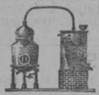
Alambique de vapor fijo ó basculante para Licores, Perfumes y Extracciones

CATALOGOS E INFORMES EN CASTELLANO, FRANCO