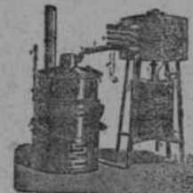
Alambique rectificador basculante, con calienta-vino.—Da 90° Rapidez y economía