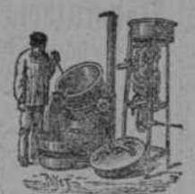
Alambique economizador de agua para destilar Orucos, Heces y Frutas Facilidad de limpiar