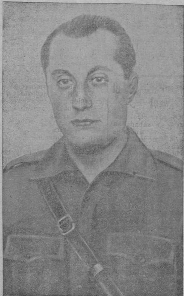
José Antonio Primo de Rivera, cuyos restos se exhumaron ayer en el cementerio de Alicante

Burgos. — La muerte del glorioso aviador García Morato ha producido honda consternación en todos los medios de esta capital.