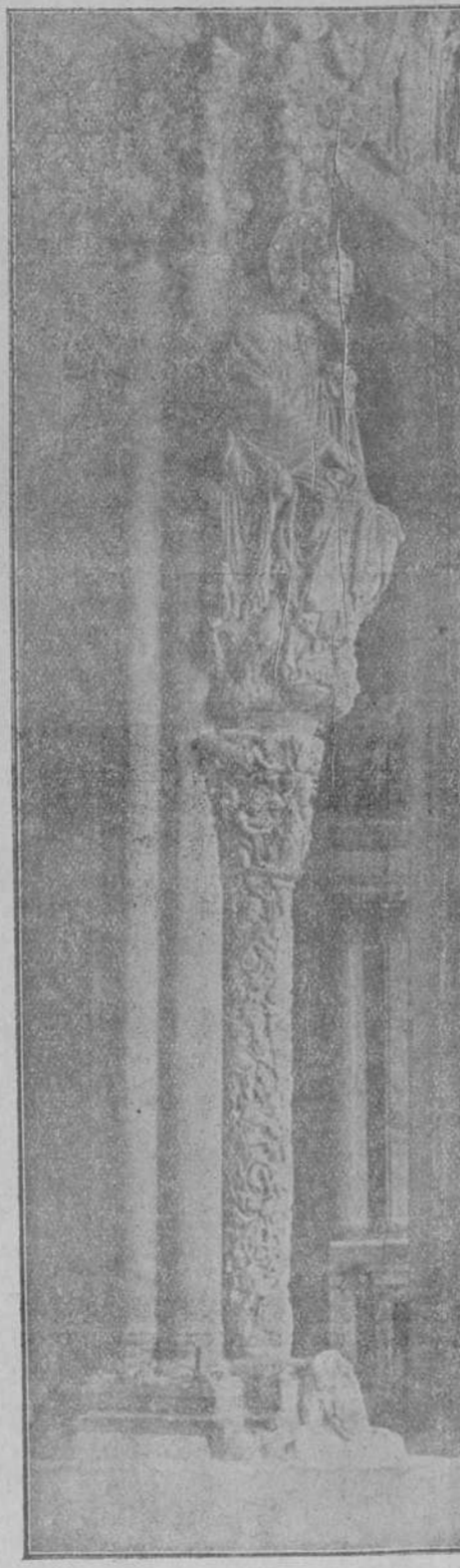
PORTICO DE LA GLORIA. COLUMNA CENTRAL