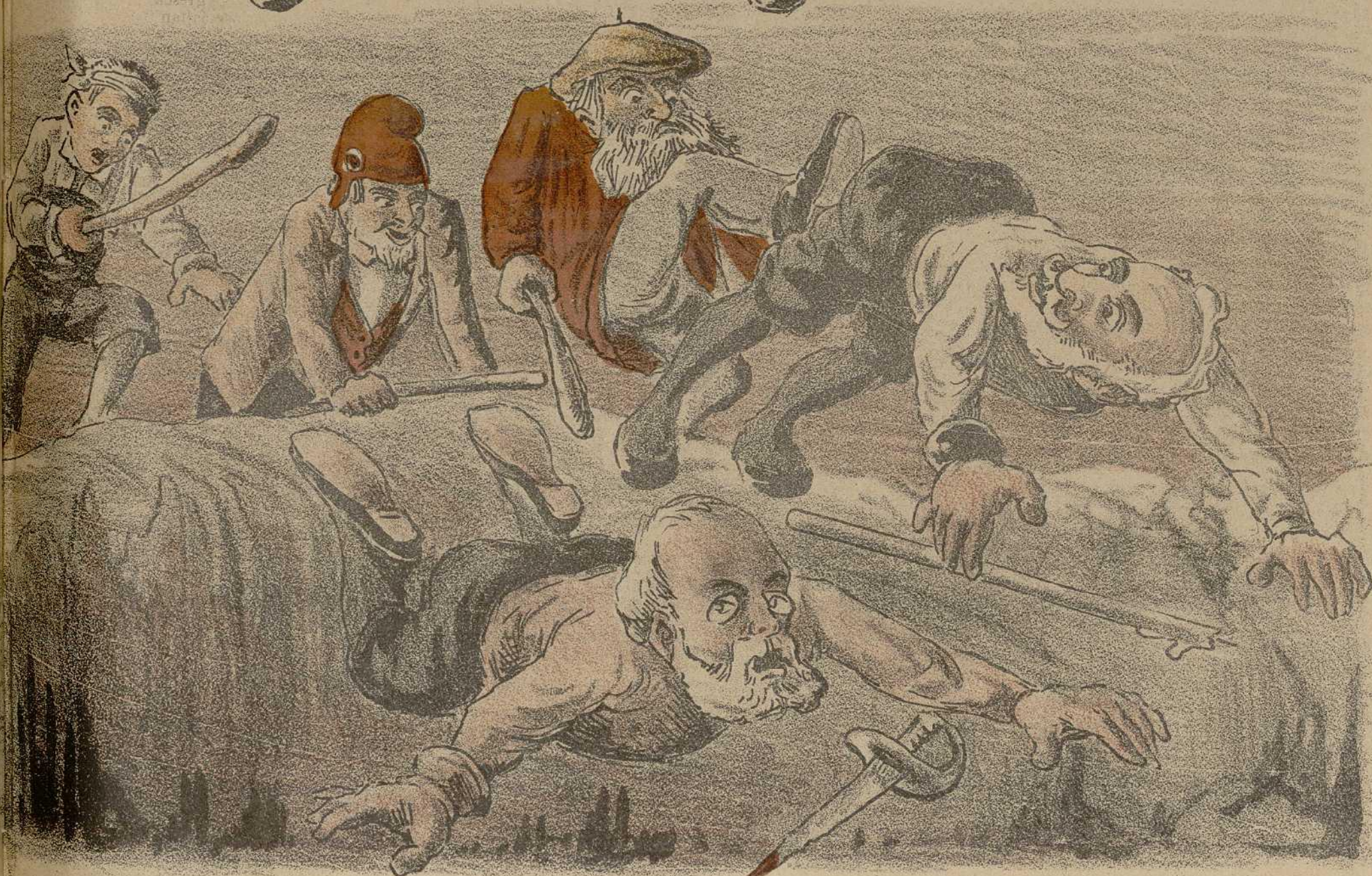
El fallo del Jurado.