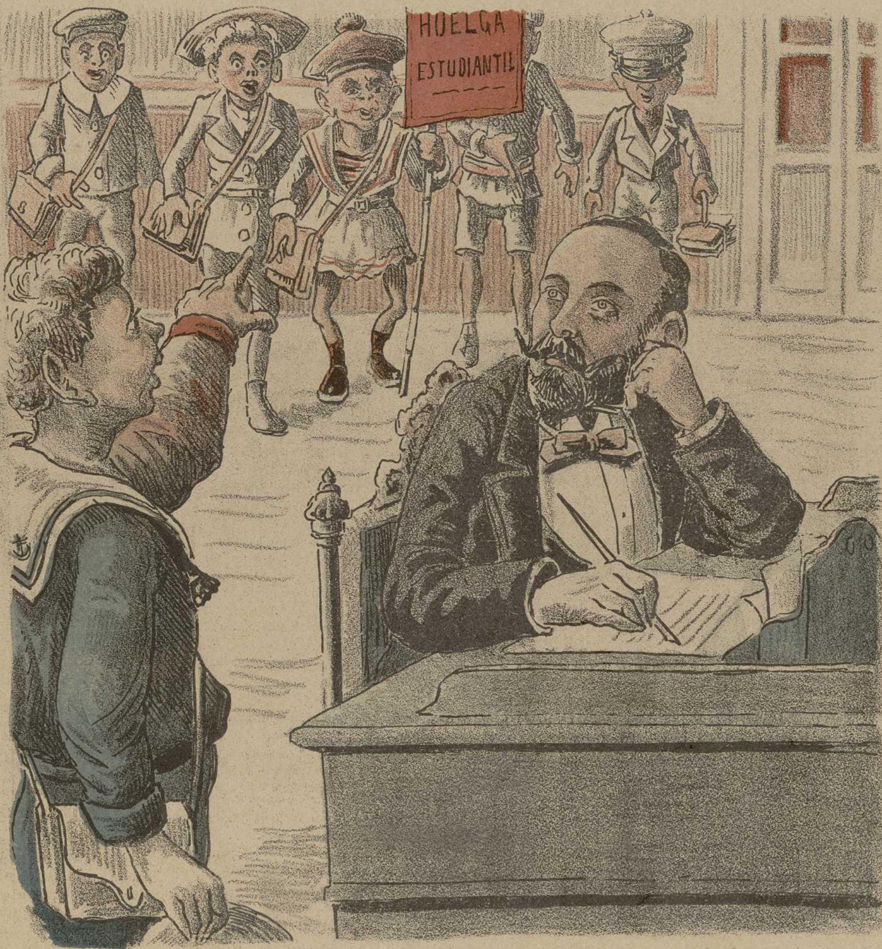
—Os lo agradezco; chicos, pues gracias á Vds. sonará alguna vez el nombre del Ministro del Ramo.

Reclamos y comunicados a precios convencionales.