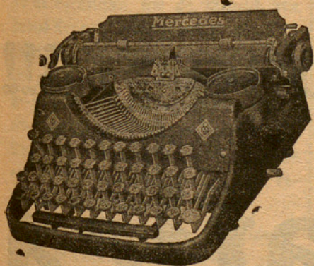
Màquines d'Oficina i portàtils de totes marques