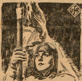
Juana de Arco