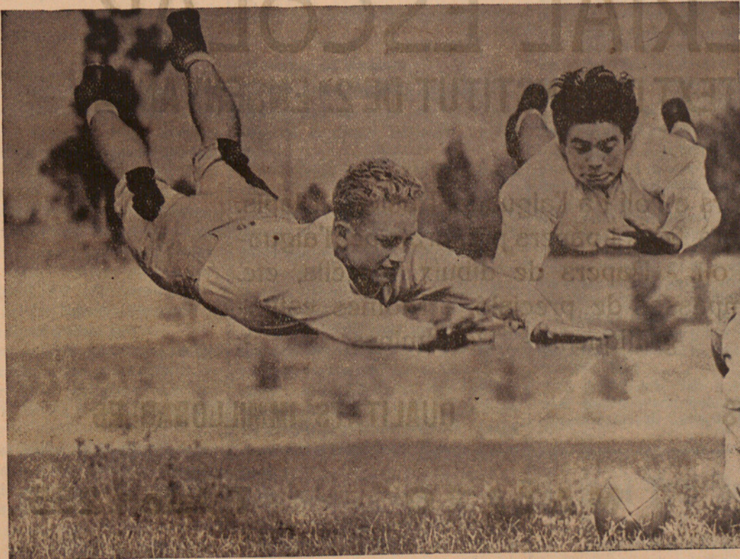
Durant el campionat americà de Rugby, jugat últimament a Los Angeles, pogué obtenir-se aquesta fotografia del «plongeon» de dos jugadors cap a la pilota. Ambdós jugadors semblen arribar planejant cap a la pilota