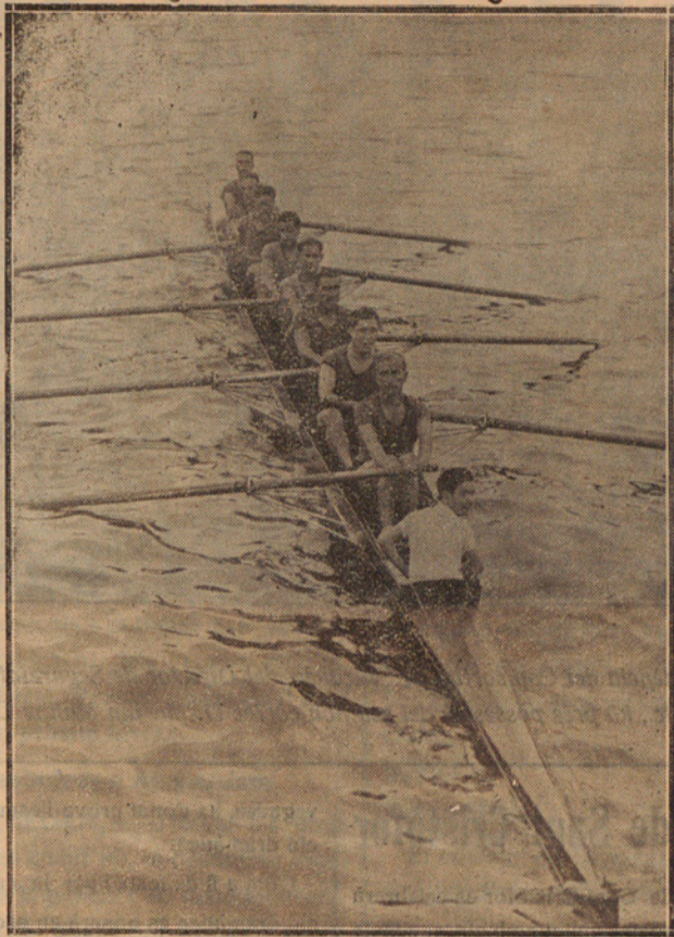
La tripulació de l'Outrigges a vuit remers, pertanyent al Club de Tarragona, que ha guanyat el Campionat de Catalunya.