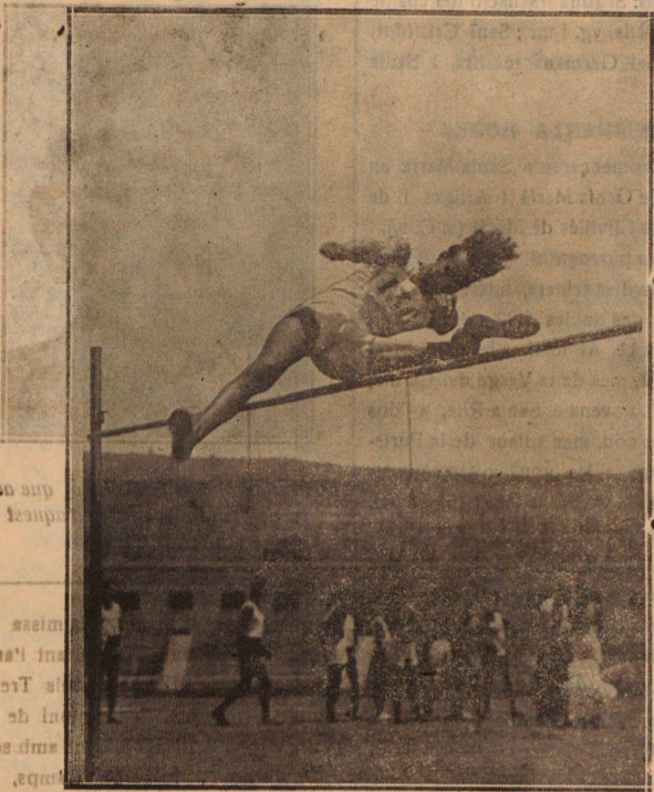
L'Independent Canyadas, en el salt en que s'adjudicà el Campionat de Catalunya de salts d'alçària, amb 1.71 metres.